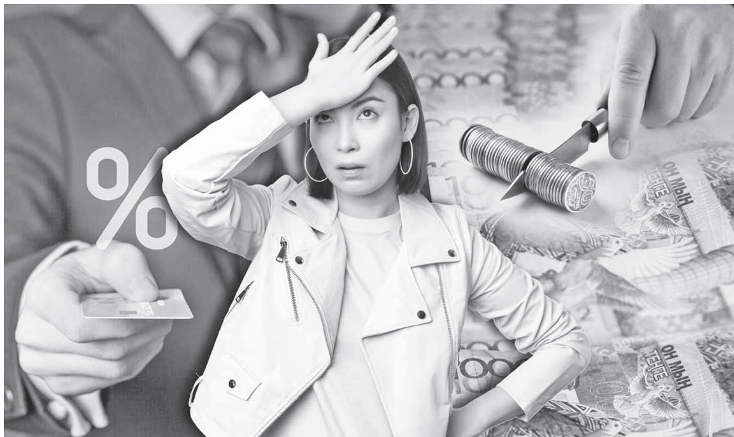
Коллаж Юрия Булушино

Улучшение благосостояния села и поддержка аграрного сектора – один из стратегических приоритетов государства. Основная задача – создать надлежащие условия для всех, кто работает на земле и кормит страну. Для этого личные под-