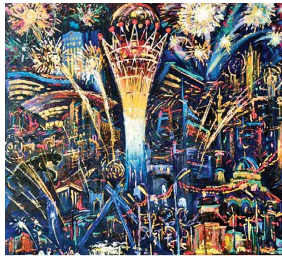
Сергей Щеголихин. «Астана праздничная». 2008 г.

Вниманию читателей! Следующий номер газеты выйдет в четверг, 11 июля 2024 года.