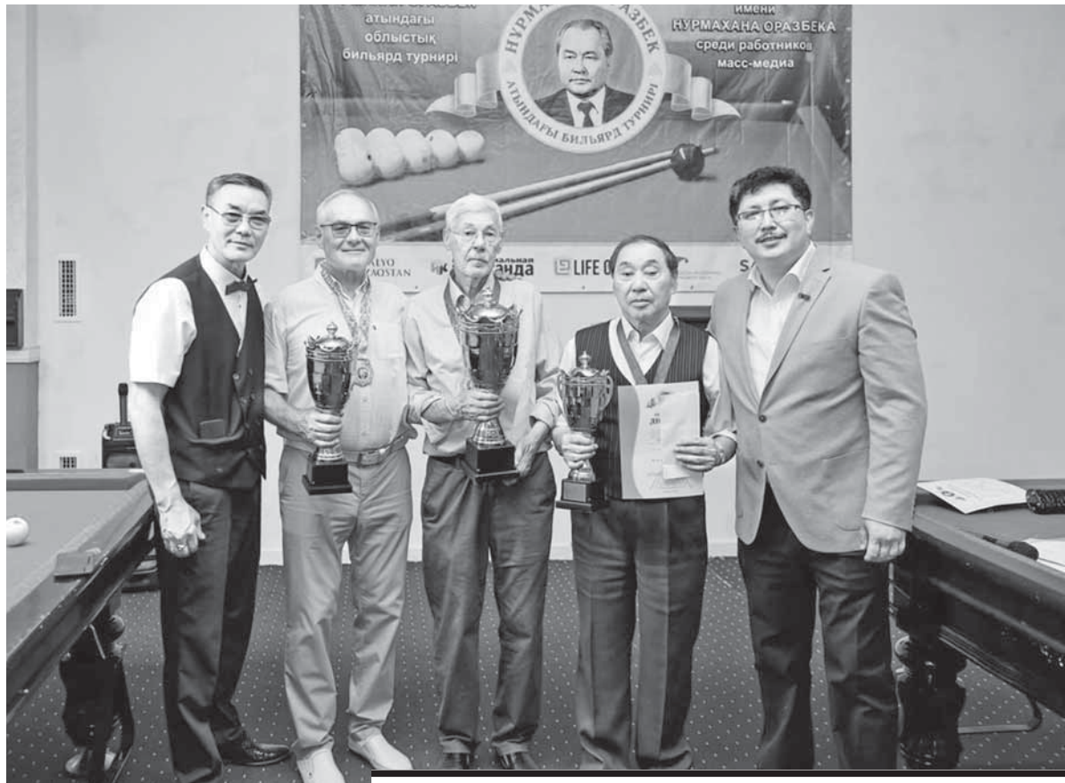
ПОБЕДИТЕЛИ БЫЛИ НАГРАЖДЕНЫ КУБКАМИ, МЕДАЛЯМИ И ДЕНЕЖНЫМИ ПРИЗАМИ.

Турнир проходил по олимпийской системе. Пары выбирали жеребьевкой. Те, кто выиграл три игры, проходили в финал соревнований.