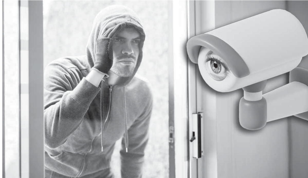
Коллаж Юрия Вилушено

В качестве примера он привел операцию по поимке матери-матери, совершившего около 20 квартирных краж. Причем осуществлял их в тех местах, где отсутствовали охранные сигнализация и видеонаблюдение. В целях профилактики полицейские реко-