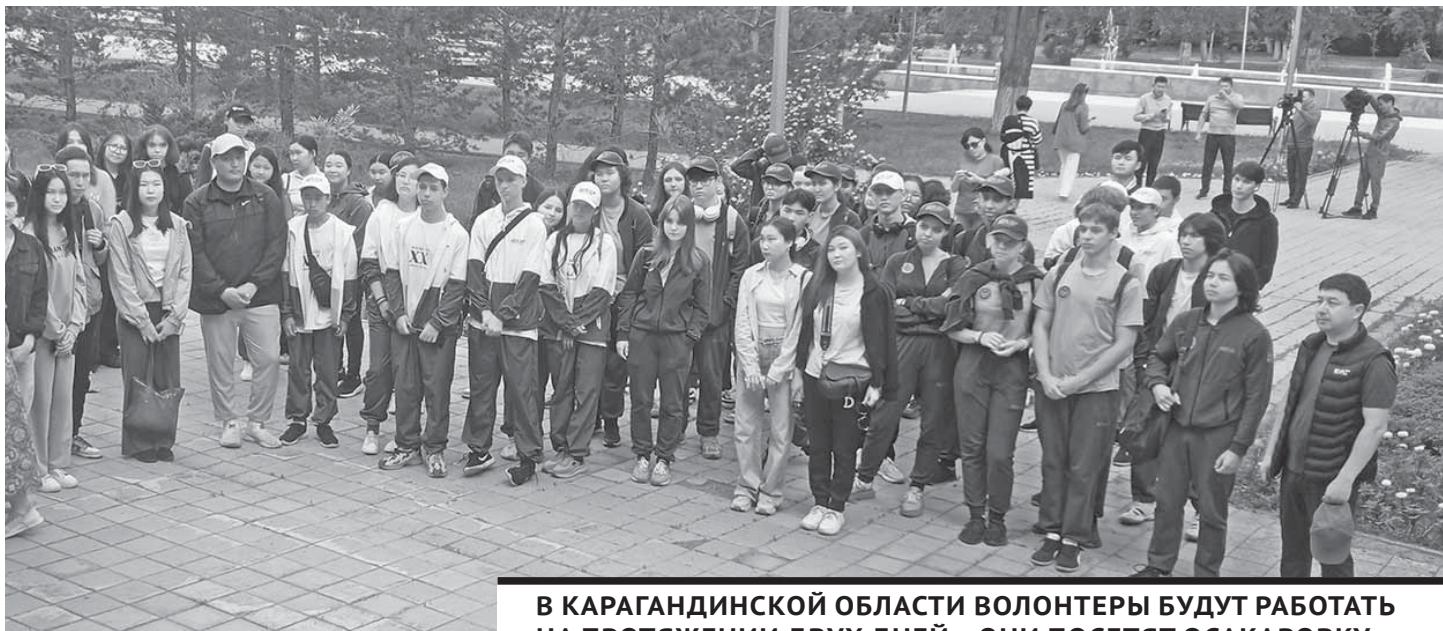
В КАРАГАНДИНСКОЙ ОБЛАСТИ ВОЛОНТЕРЫ БУДУТ РАБОТАТЬ НА ПРОТЯЖЕНИИ ДВУХ ДНЕЙ – ОНИ ПОСЕТЯТ ОСАКАРОВКУ, АКСУ-АЮЛЫ, БАЛХАШ, ПРИОЗЕРСК. ПОМОЩЬ ПРИДОРОЖНОЙ ТЕРРИТОРИИ, УЧАСТНИКИ АКЦИИ ПРОВЕДУТ УБОРКУ НА ПЛОЩАДКАХ АВТОСТОЯНОК И КЕМПИНГОВ, ПРИЛЕГАЮЩИХ К ТРАССЕ.

Она проходит под эгидой общенациональной акции «Таза Қазақстан», инициированной Главой государства. За неделю участники пробега планируют очистить придорожную территорию вдоль трассы, ведущей от Астаны к Алматы.