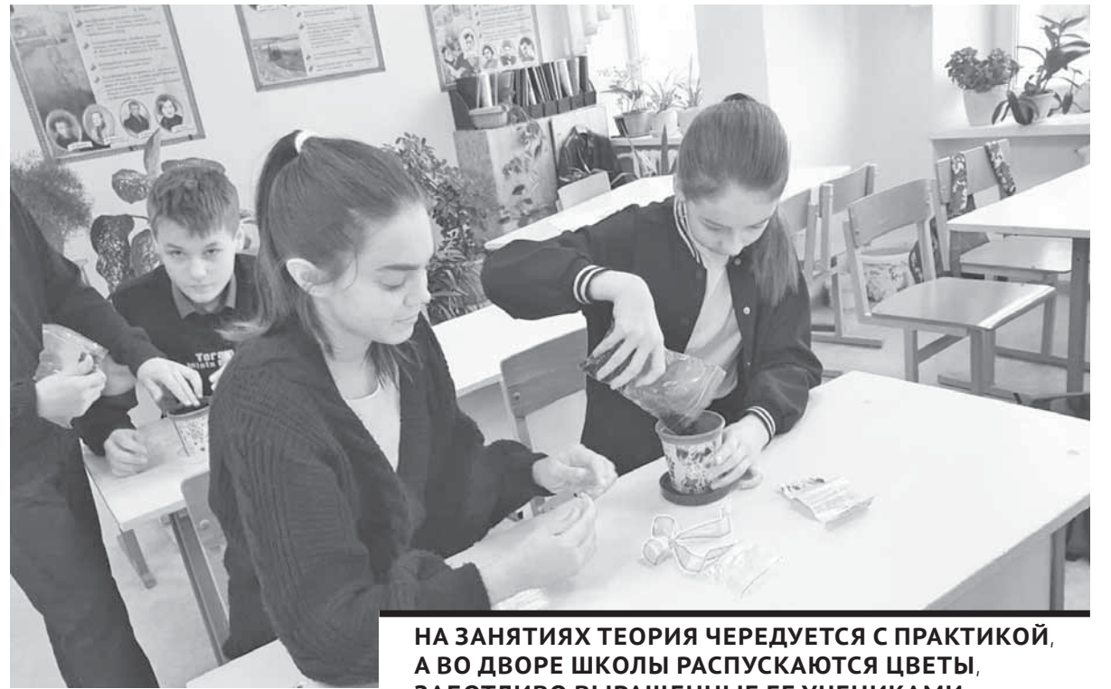
НА ЗАНЯТИЯХ ТЕОРИЯ ЧЕРЕДУЕТСЯ С ПРАКТИКОЙ, А ВО ДВОРЕ ШКОЛЫ РАСПУСКАЮТСЯ ЦВЕТЫ, ЗАБОТЛИВО ВЫРАЩЕННЫЕ ЕЕ УЧЕНИКАМИ.

панова отмечает, что они хотят сформировать новое поколение аграриев, умеющих с большой пользой для себя и общества применять на практике полученные знания и навыки. А без учебно-производственной базы это невозможно. Поэтому они сотрудничают с высшими агротехническими и средними профессионально-техническими учебными заведениями. Все это помогает ученикам определиться с выбором профессии и сформировать у них агрономические навыки.