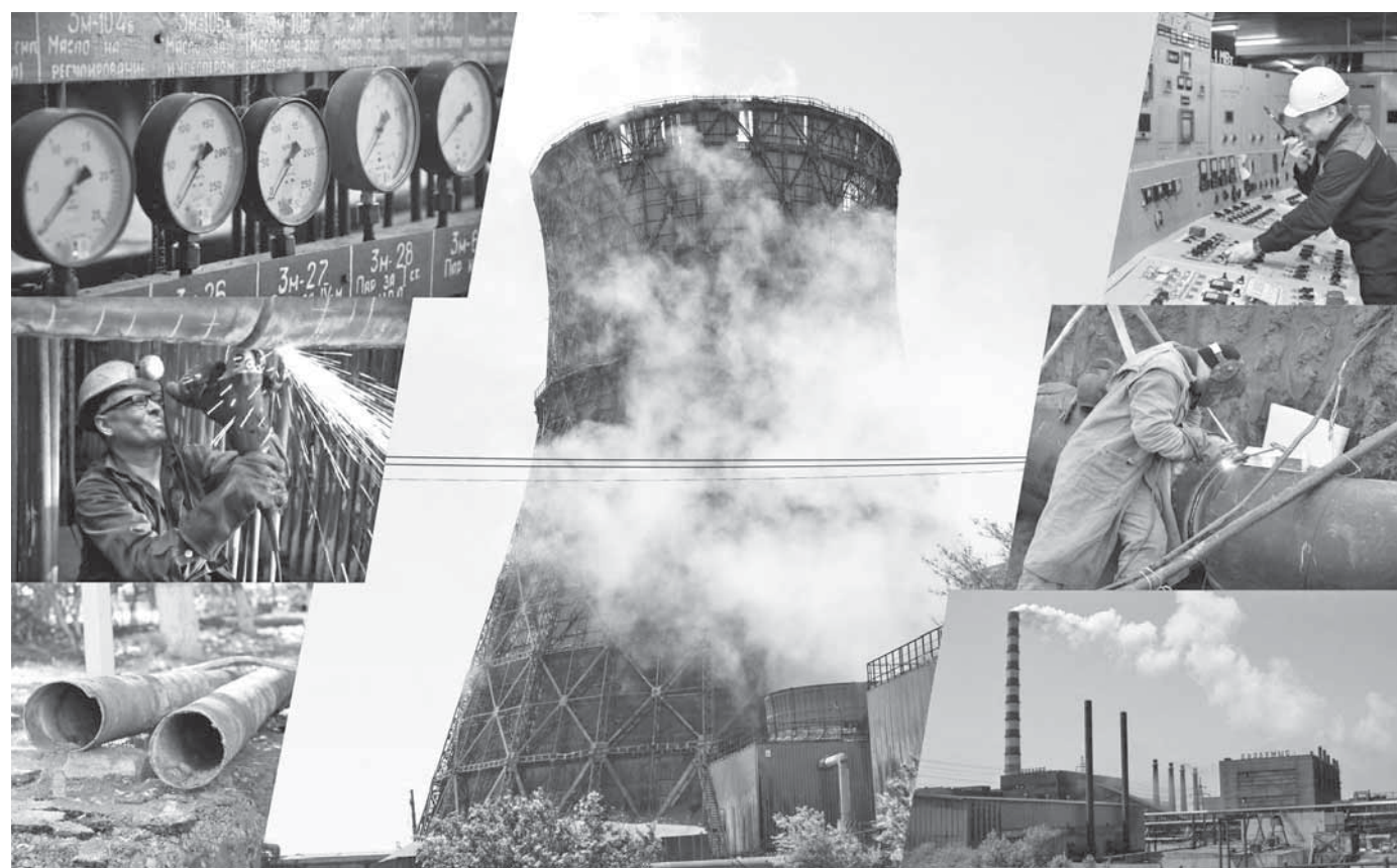
Коллаж: Юлия Выпущенко

Отработав отопительный сезон, регион уже готовится безаварийно пройти следующий. Также проводятся ремонт и реконструкция сетей водо-, тепло- и электроснабжения, газификация, а также мероприятия в рамках акции «Таза Қазақстан».