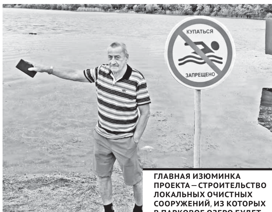
ГЛАВНАЯ ИЗЮМИНКА ПРОЕКТА – СТРОИТЕЛЬСТВО ЛОКАЛЬНЫХ ОЧИСТНЫХ СООРУЖЕНИЙ, ИЗ КОТОРЫХ В ПАРКОВОЕ ОЗЕРО БУДЕТ ПОСТУПАТЬ УЖЕ ОЧИЩЕННАЯ ВОДА, БЕЗ ПРИМЕСЕЙ И МУСОРА.

– Да, общественники регулярно проводят экологические акции на Федоровском водохранилище и в Центральном парке, работают на очистке русла Большой Букпы. Такие акции – хороший спо-