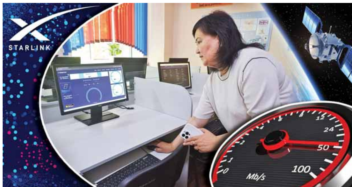
Композ. Юрия Вилушенко

Все учебные заведения Карагандинской области на данный момент подключены к сети Интернет. Услуги оказывают через 612 точек подключения. Однако в прошлом году была проведена инвентаризация, выявившая, что из 412 школ региона в 143 скорость Интернета не соответствует даже минимальным требованиям. Там, где имелась техническая возможность, ее увеличили с помощью новых проводов и модемов, таким образом показатели повысились в 38 школах. Оставшимся 106 организациям образования области, где невозможно провести широкополосный Интернет,