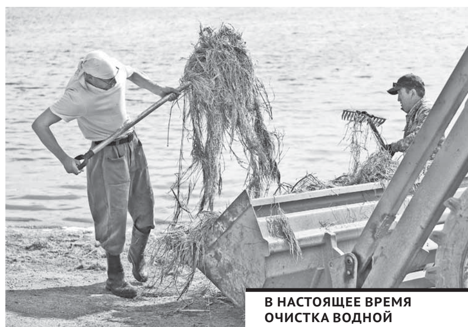
В НАСТОЯЩЕЕ ВРЕМЯ ОЧИСТКА ВОДНОЙ ГЛАДИ В ЦПКИО ПОКА ПРОИЗВОДИТСЯ ВРУЧНУЮ.