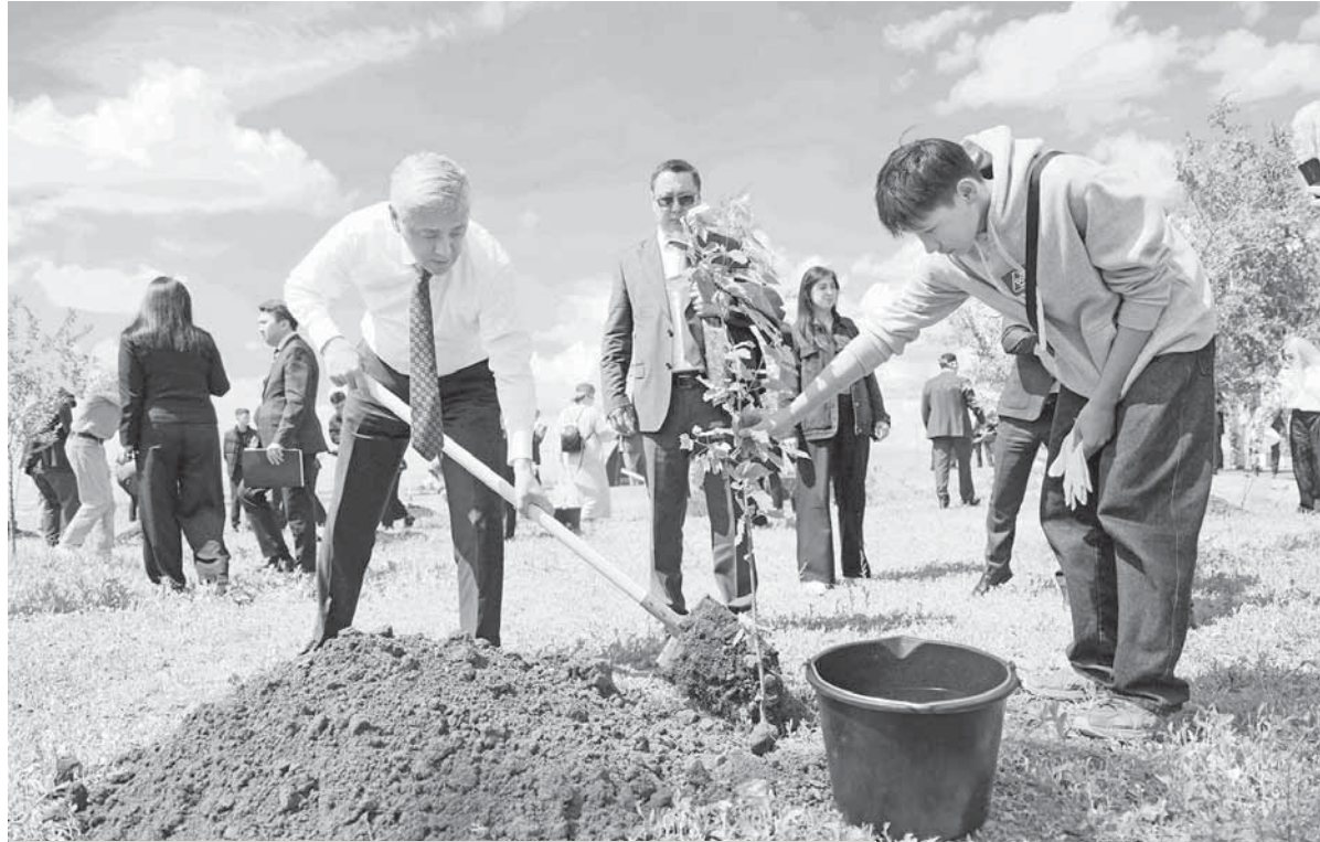
УЧАСТНИКИ ФОРУМА ТАКЖЕ ПОСАДИЛИ ДЕРЕВЬЯ ВОЗЛЕ ДВОРЦА КУЛЬТУРЫ В ТЕМИРТАУ, ПОДЧЕРКИВАЯ ВАЖНОСТЬ ЗАБОТЫ О ПРИРОДЕ И ЭКОЛОГИЧЕСКОЙ БЕЗОПАСНОСТИ.

экологическим проблемам промышленных регионов и поделиться идеями по их решению, на форуме собрались представители Министерства экологии и природных ресурсов Республики Казахстан, международных организаций, научного сообщества и