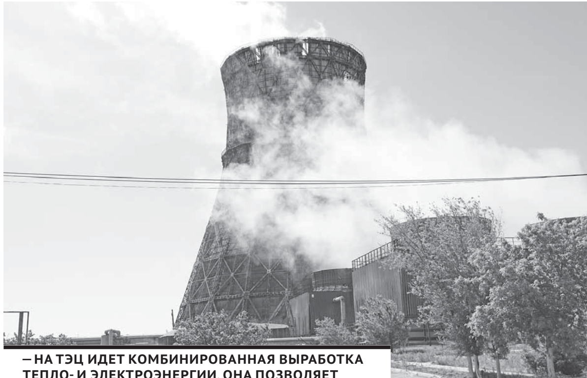
– НА ТЭЦ ИДЕТ КОМБИНИРОВАННАЯ ВЫРАБОТКА ТЕПЛО- И ЭЛЕКТРОЭНЕРГИИ. ОНА ПОЗВОЛЯЕТ ЗНАЧИТЕЛЬНО УДЕШЕВИТЬ ПРОЦЕСС.

Для непосвященного человека при слове «котел» представляется емкость вроде куба. А на теплоэлектростанциях котлоагрегат выглядит как трубы различных диаметров, в которых циркулирует пар или вода. Принцип работы котла можно назвать одним словом – парогенератор, уточняет наш собеседник. Здесь при сжигании угля температура достигает 1100-1200 градусов. Трубы тут не