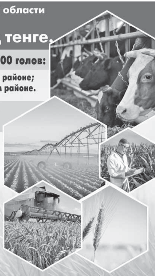
Коллаж Юрия Булушченко