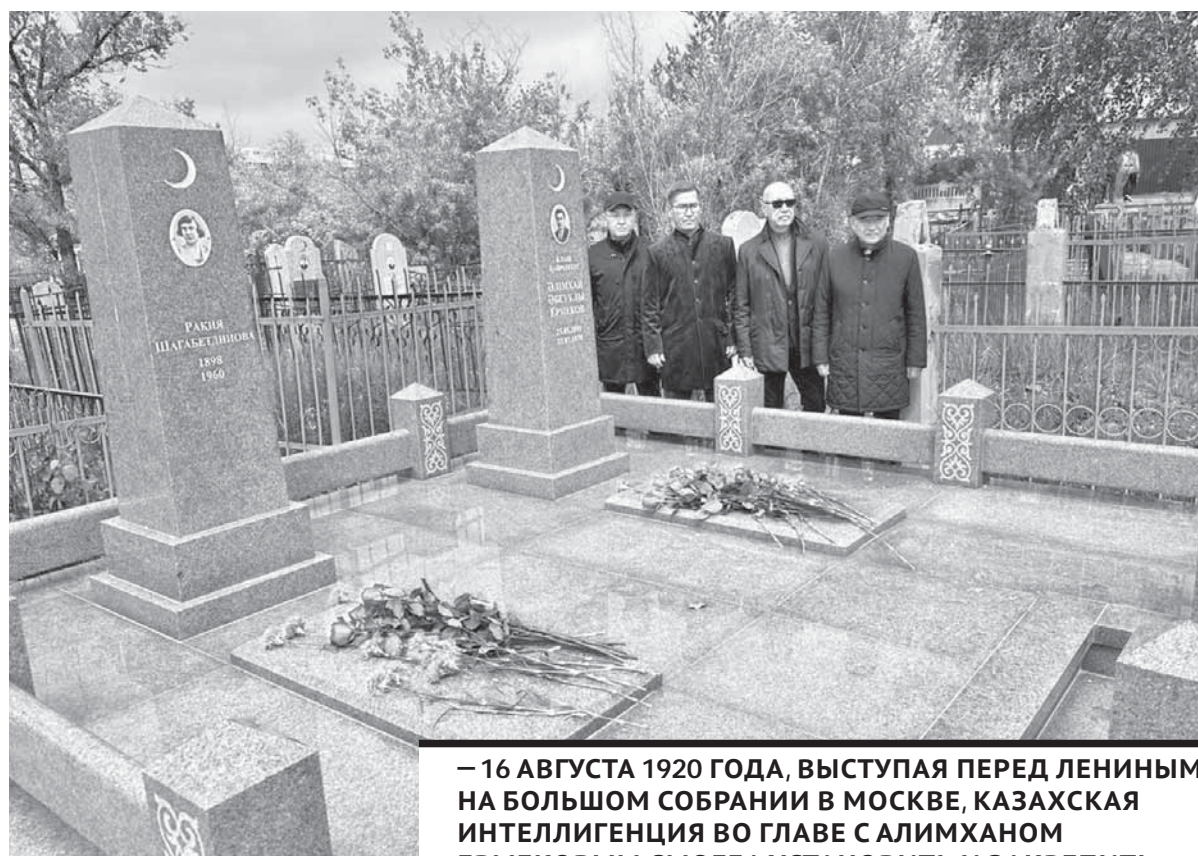
– 16 АВГУСТА 1920 ГОДА, ВЫСТУПАЯ ПЕРЕД ЛЕНИНЫМ НА БОЛЬШОМ СОБРАНИИ В МОСКВЕ, КАЗАХСКАЯ ИНТЕЛЛИГЕНЦИЯ ВО ГЛАВЕ С АЛИМХАНОМ ЕРМЕКОВЫМ СМОГЛА УСТАНОВИТЬ И ЗАКРЕПИТЬ ГРАНИЦЫ НАШЕЙ ЗЕМЛИ.

– 16 августа 1920 года, выступая перед Лениным на большом собрании в Москве, казахская интеллигенция во главе с Алимханом Еркемовым смогла установить и закрепить границы нашей земли. Наряду с Алимханом Еркемовым нельзя забывать и преданного сына казахского народа, великого представителя западной «Алаш Орды» Уалитхана Тана-