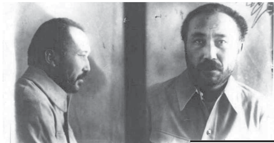
САКЕН СЕЙФУЛЛИН ВО ВРЕМЯ АРЕСТА И ЗАКЛЮЧЕНИЯ В АЛМА-АТЕ.

(Окончание. Начало в номере от 25 мая 2024 г.)