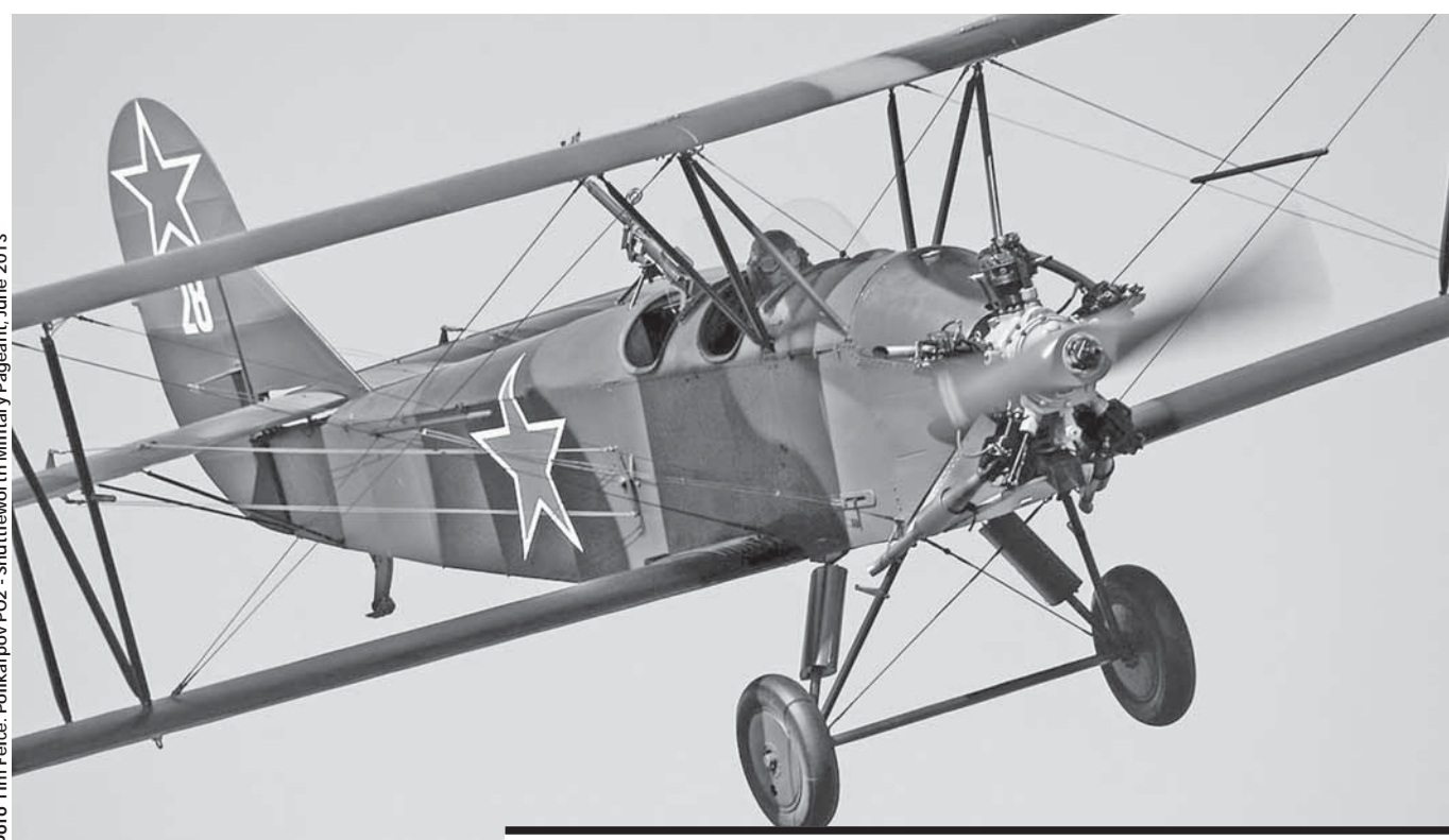
БИПЛАН ПО-2, НА КОТОРОМ СРАЖАЛИСЬ ЖЕНЩИНЫ-ЛЕТЧИЦЫ В ГОДЫ ВОЙНЫ.