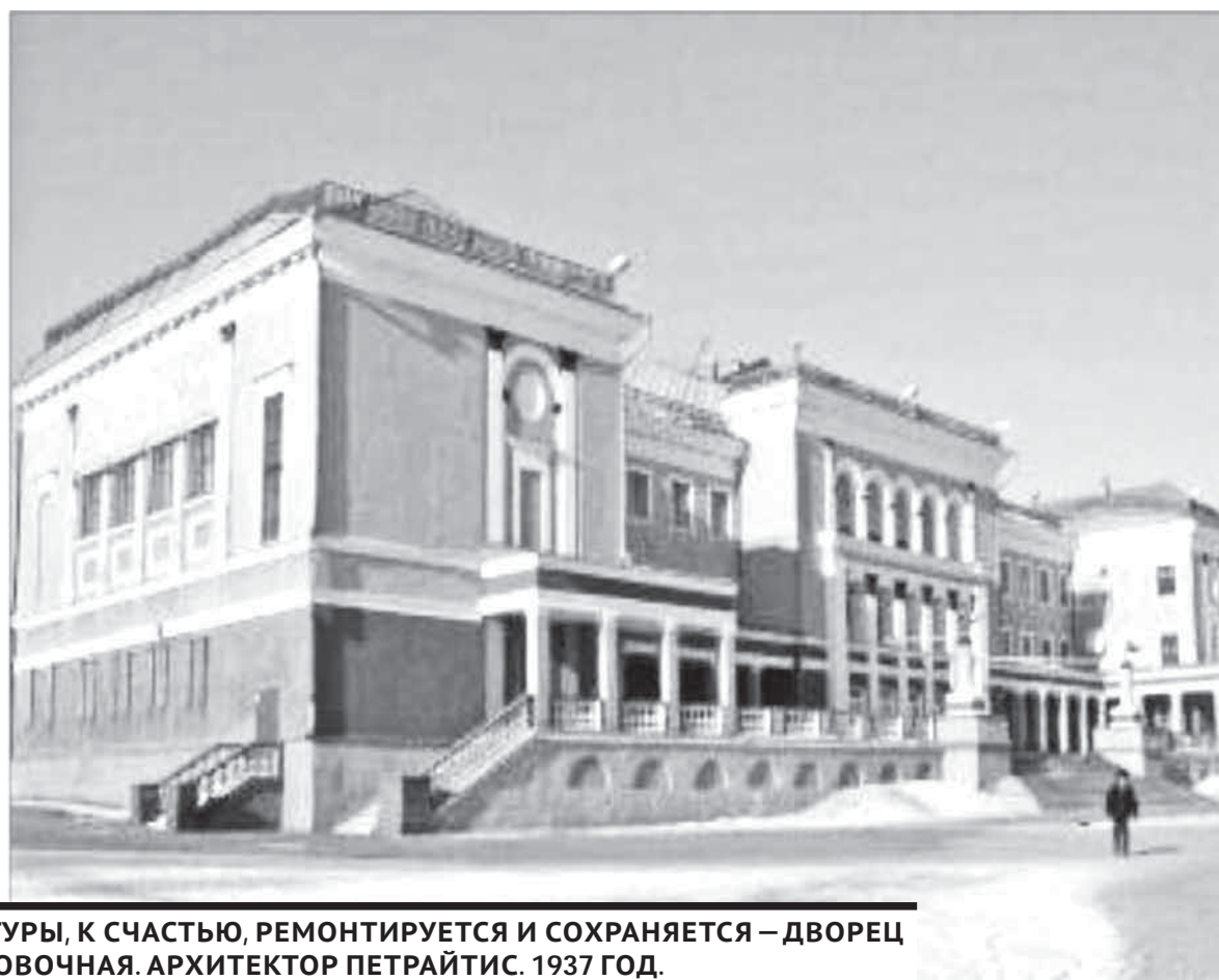
ЕЩЕ ОДИН ДОСТОЙНЫЙ ВНИМАНИЯ ПАМЯТНИК АРХИТЕКТУРЫ, К СЧАСТЬЮ, РЕМОНТИРУЕТСЯ И СОХРАНЯЕТСЯ – ДВОРЕЦ ЖЕЛЕЗНОДОРОЖНИКОВ НА СТАЦИИ КАРАГАНДА-СОТИРОВОЧНАЯ. АРХИТЕКТОР ПЕТРАЙТИС. 1937 ГОД.