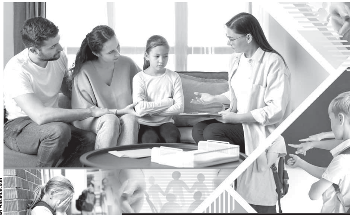
Коллаж Натальи Романовской

Прошлым летом была ситуация: в общественный центр «Тең қоғам», который оказывает помощь людям с инвалидностью, обратилась женщина. Она как инвалид второй группы просила материальную поддержку. Когда специалисты центра установили ее данные, оказалось, что ее девятилетний ребенок ни дня не посещал школу. Таким образом случайно выявили необучаемого ребенка. Отлично, что с недавних пор действует закон, согласно которому такие нерадивые родители будут привлекаться к ответственности. Причину подобного поведения в отношении своего ребенка мама объясняла тем, что у нее был негативный опыт в дошкольном учреждении Жезказгана. Она вступила в конфронтацию с воспитателями в детском саду, что привело к полной изоляции ребенка от социума. Вдобавок из-за психических особенностей