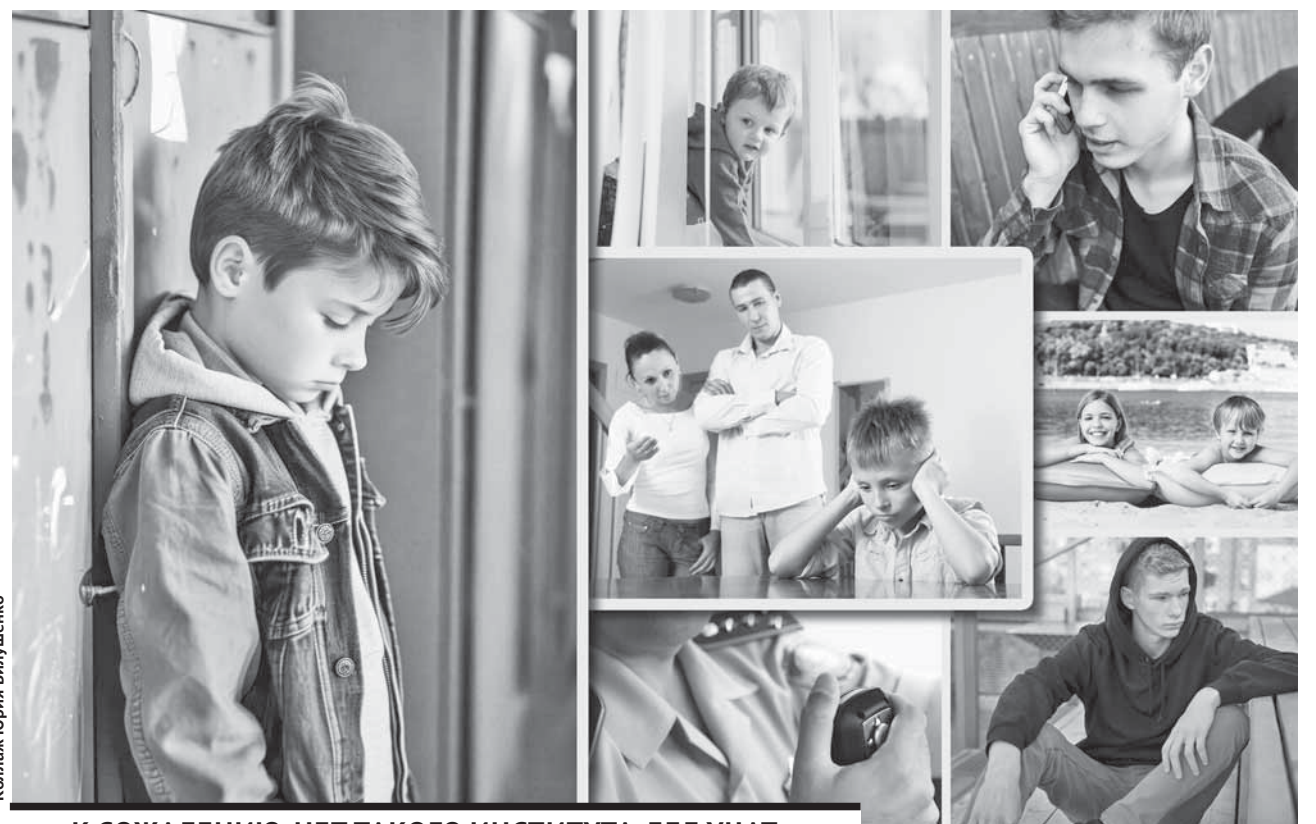
– К СОЖАЛЕНИЮ, НЕТ ТАКОГО ИНСТИТУТА, ГДЕ УЧАТ БЫТЬ РОДИТЕЛЯМИ. И ТО, ЧТО ЗНАЮЩИЕ СПЕЦИАЛИСТЫ ВОТ ТАК МОГУТ ВЫЙТИ К НАМ, ПОДСКАЗАТЬ, ПОСОВЕТОВАТЬ, – ЭТО ОЧЕНЬ ЦЕННО.

Главными темами собрания стали безопасность детей, вакцинация,