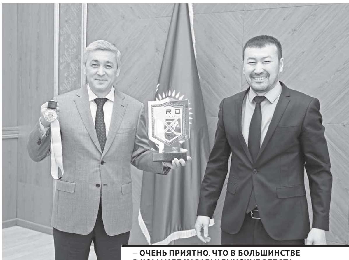
– ОЧЕНЬ ПРИЯТНО, ЧТО В БОЛЬШИНСТВЕ В КОМАНДЕ КАРАГАНДИНСКИЕ РЕБЯТА, ЯВЛЯЮЩИЕСЯ ВОСПИТАННИКАМИ МЕСТНОЙ ШКОЛЫ ХОККЕЯ.

– Хочу выразить слова благодарности директору клуба, главному тренеру, игрокам, болельщикам за преданность и слаженную поддержку нашей команды. Вы показали честную, красивую и зрелищную игру. Благодаря ей в нашем регионе возрос интерес к хоккею. Очень приятно, что в большинстве в команде карагандинские ребята, являю-