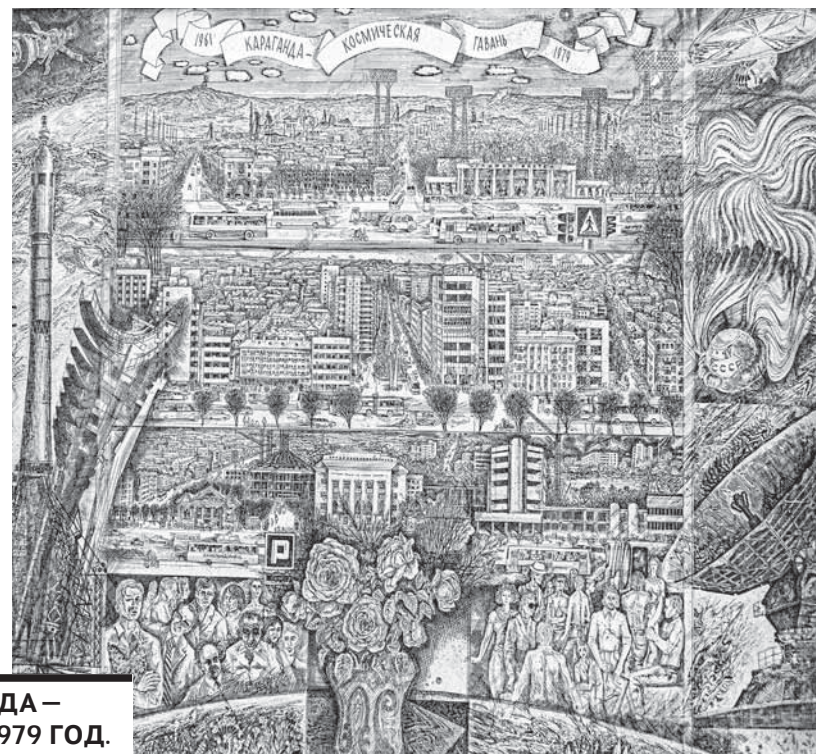
Н.Г. РАСТОПЧИН. «КАРАГАНДА – КОСМИЧЕСКАЯ ГАВАНЬ». 1979 ГОД.