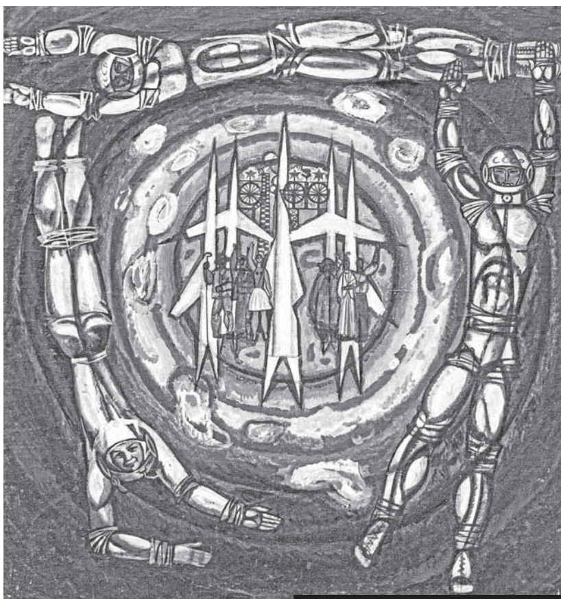
В.И. КРЫЛОВ. «СЛАВА КОСМОСУ».

Одно из высших достижений человечества – это освоение космического пространства, начавшееся в XX веке. Полет советского космонавта Юрия Гагарина 12 апреля 1961 года в космос повлиял на развитие всех сфер жизни, в том числе и на изобразительное искусство. Художники вдохновлялись образом первого космонавта и ракетами, а шахтерская столица стала известной как космическая гавань.