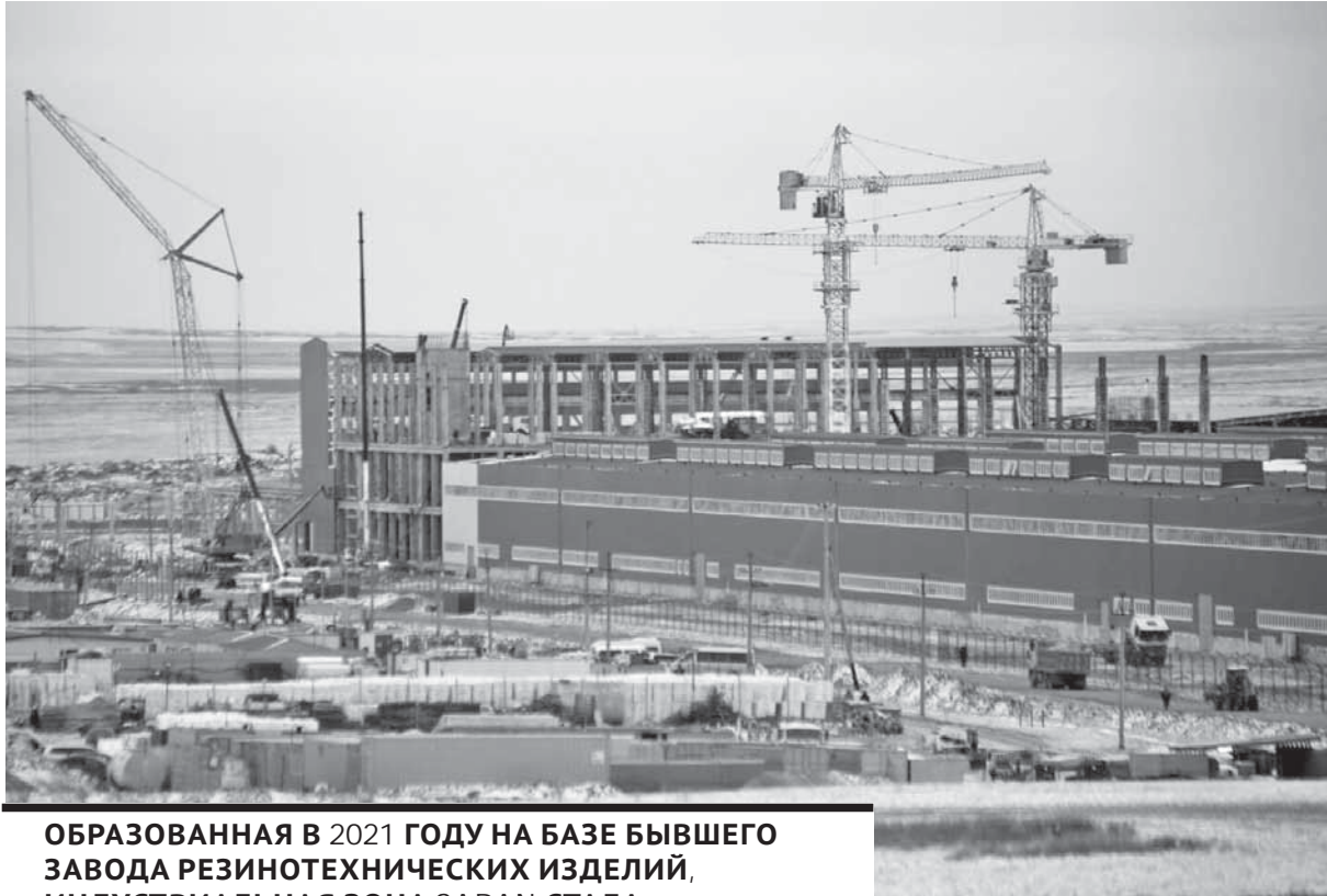
ОБРАЗОВАННАЯ В 2021 ГОДУ НА БАЗЕ БЫВШЕГО ЗАВОДА РЕЗИНОТЕХНИЧЕСКИХ ИЗДЕЛИЙ, ИНДУСТРИАЛЬНАЯ ЗОНА SARAN СТАЛА ТОЧКОЙ РОСТА ДЛЯ РАЗВИТИЯ МОНОГОРОДА И ДИВЕРСИФИКАЦИИ ЭКОНОМИКИ ОБЛАСТИ.

Аким Карагандинской области Ермаганбет Булекпаев, докладывая о результатах создания большой промышленной площадки в городе Сарани, сообщил, что это позволило придать новый импульс развитию населенного пункта. Образованная в 2021 году на базе бывшего завода резинотехнических изделий, она стала точкой роста для развития моногорода и диверсификации экономики области. Сегодня на ее территории уже реализован ряд крупных проектов. Там расположились заводы по производству автобусов, шин, бытовой техники. Планируются новые проекты в сфере металлургии. Индустриальная зона Сарани дала второе дыхание городу: восстанавливаются ранее брошенные многоэтажные дома, на дорогах