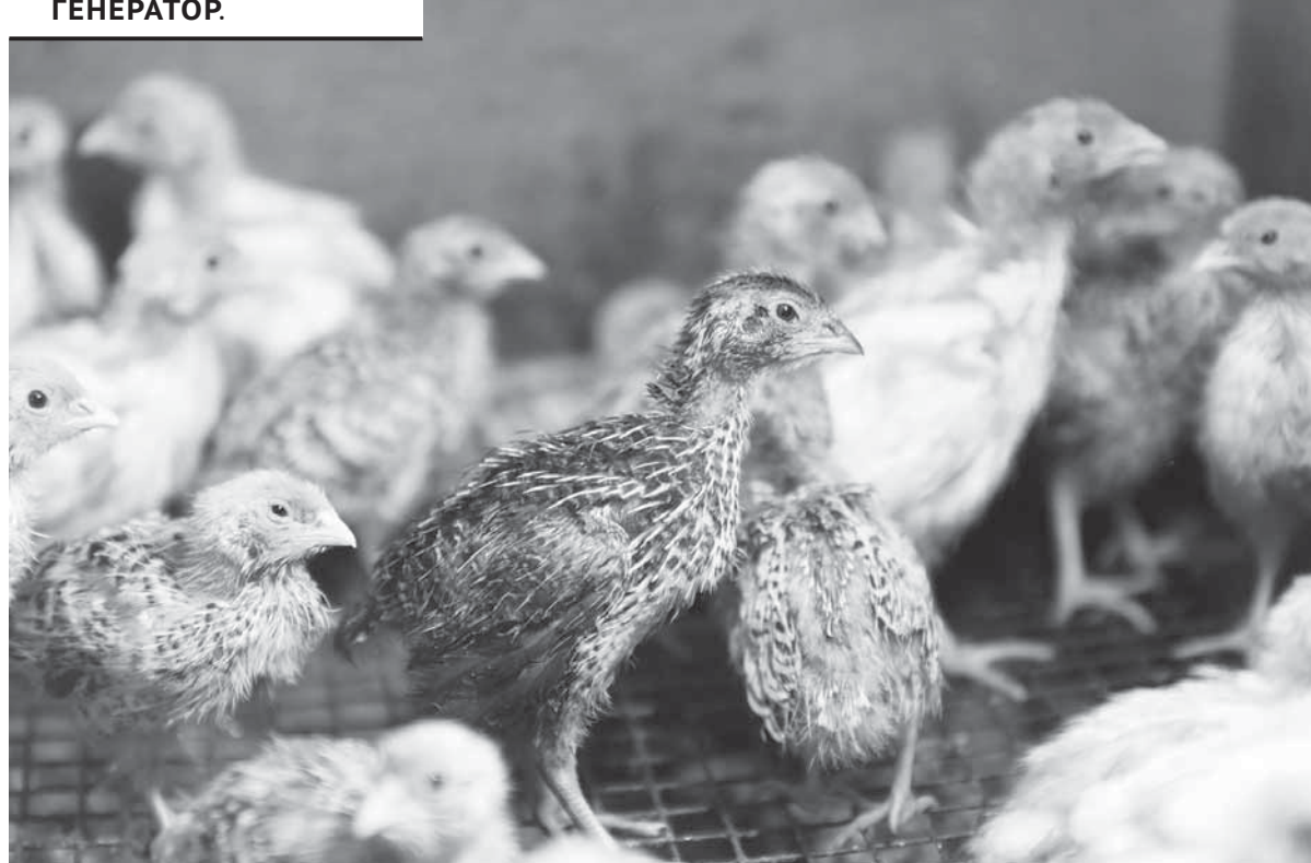
Нурынский район