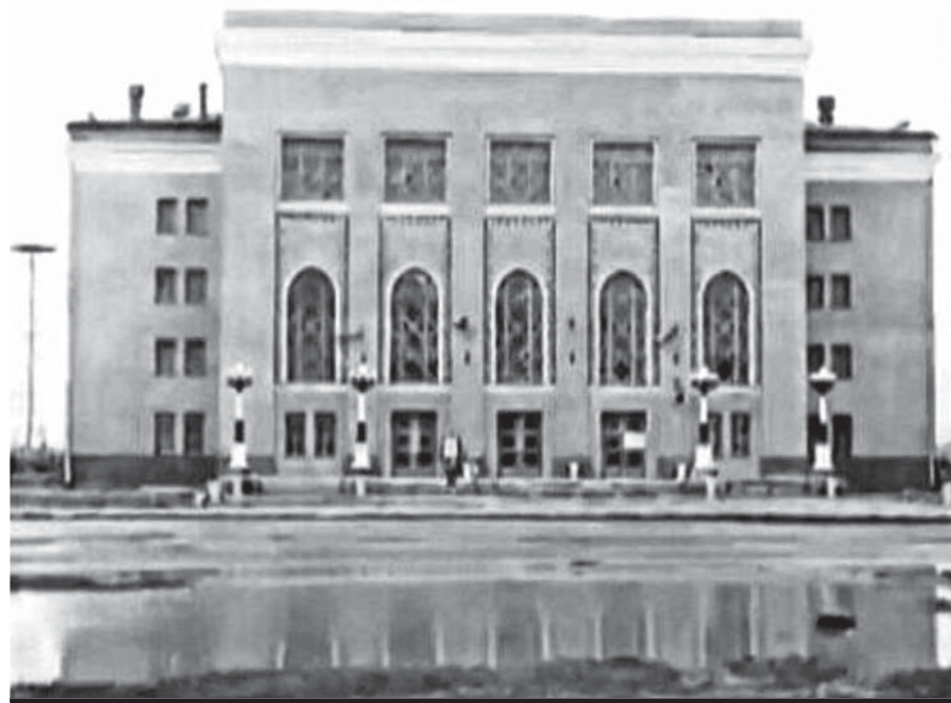
ДВОРЕЦ СПОРТА. АРХИТЕКТОР И.И. РАЙКИН. 1958 ГОД.

году Караганда станет еще богаче, наряднее, красивее» («Социалистическая Караганда» 1 января 1950 года).