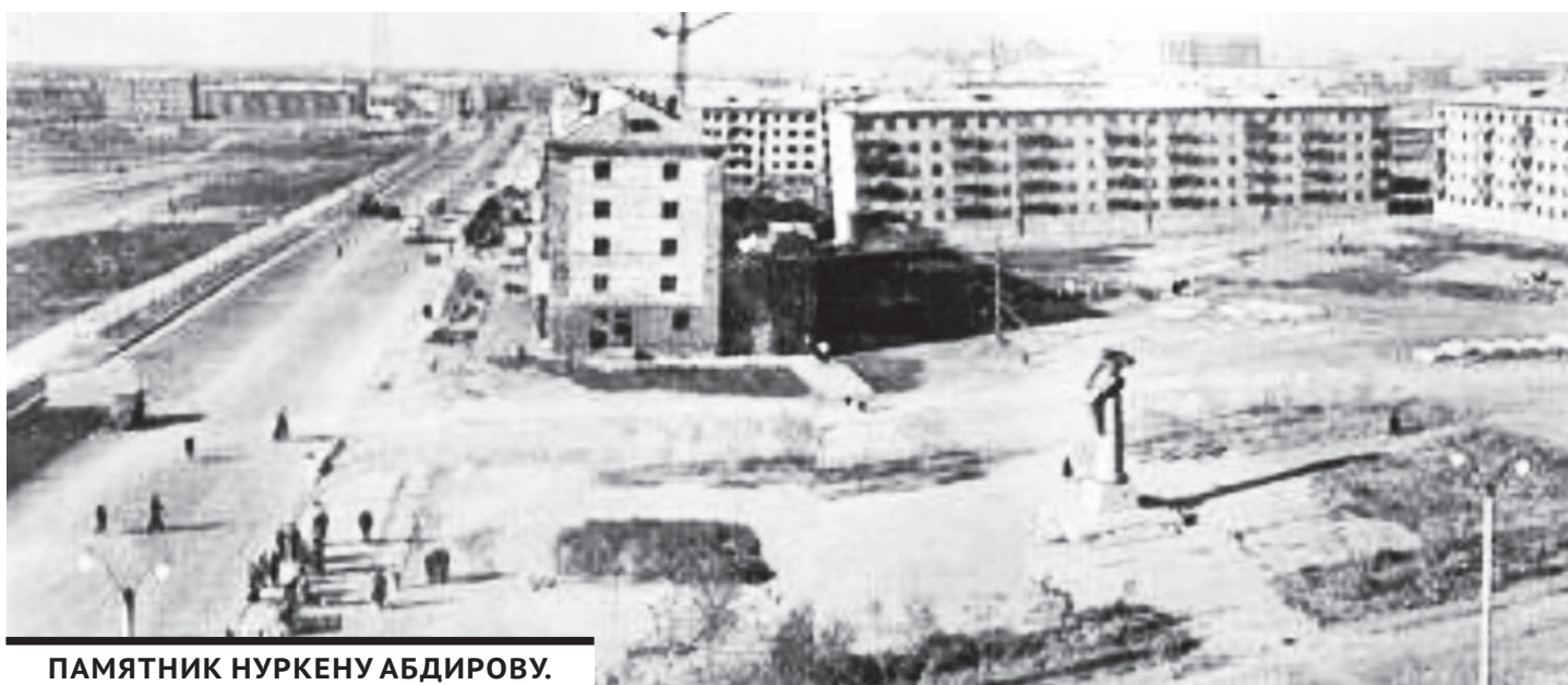
ПАМЯТНИК НУРКЕНУ АБДИРОВУ.

И не с потолка архитектуры его в проект внесли. Если перелистать газеты тех лет, можно найти: «...Чтоб свои народные у нас /Петь могли Сусанина на сце-