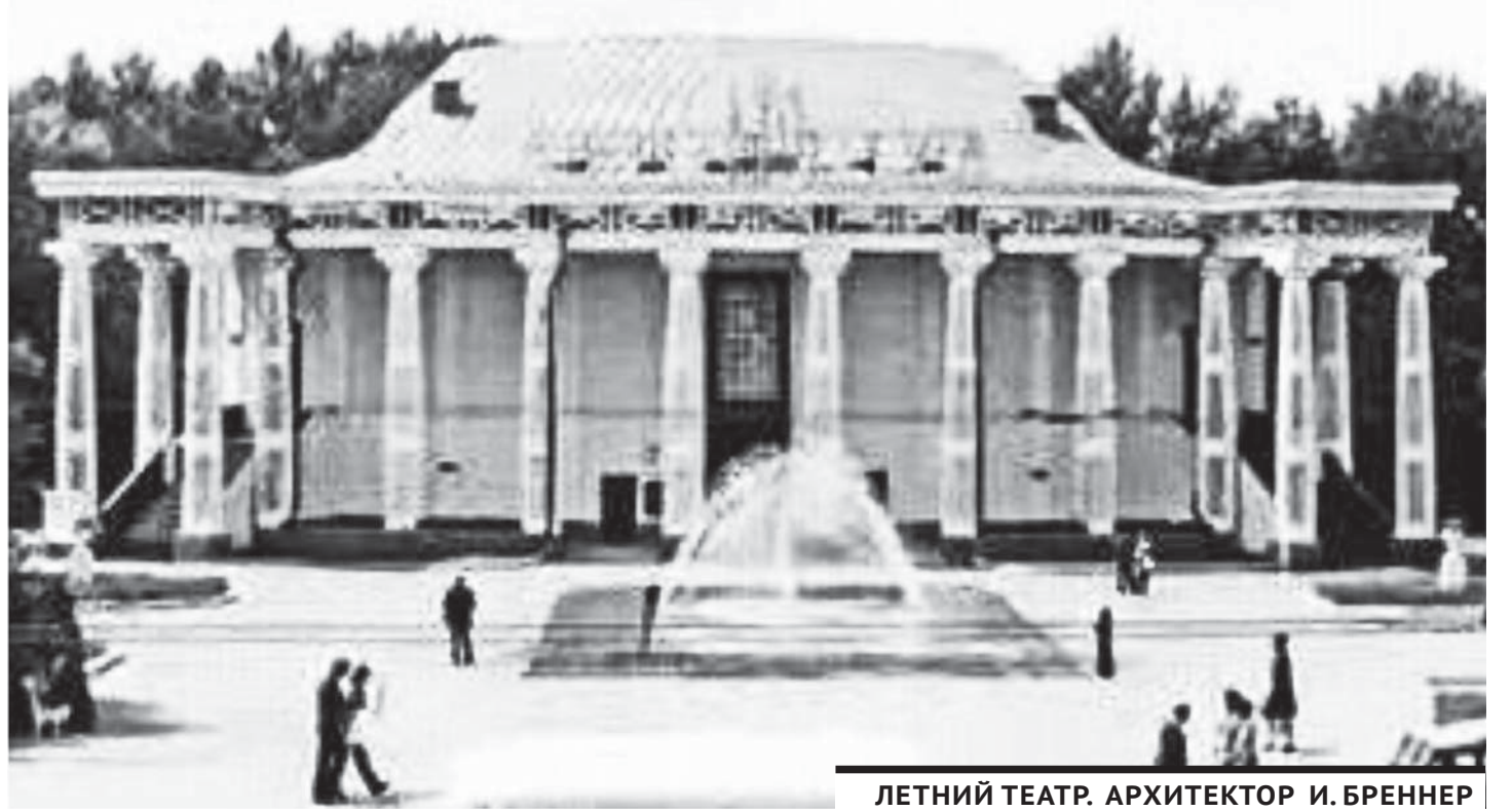
ЛЕТНИЙ ТЕАТР. АРХИТЕКТОР И. БРЕННЕР

Расширятся массивы зеленых насаждений, на новых километрах улиц будут установлены сотни столбов электрического освещения. Новые киоски, павильоны, кафе оживят и украсят город. Ажурными металлическими ограждениями окружаются сады, скверы и палисады улиц, чудесным ковром цветов покроются клумбы. В наступающем 1950