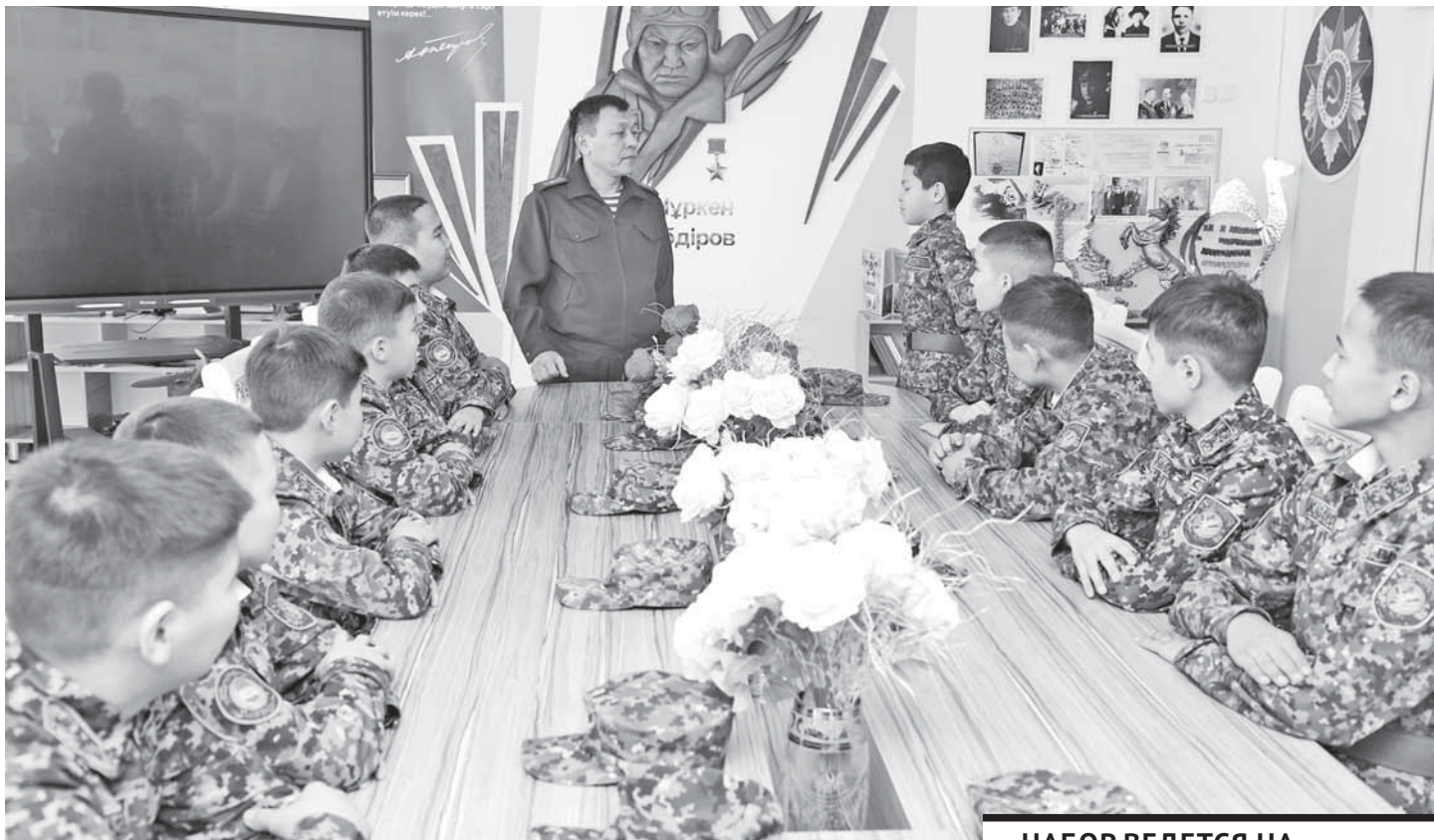
НАБОР ВЕДЕТСЯ НА КОНКУРСНОЙ ОСНОВЕ, В ПЕРВУЮ ОЧЕРЕДЬ УЧИТЫВАЕТСЯ УСПЕВАЕМОСТЬ.

К победе школа имени Нуркена Абдирова шла с 2018 года, выступив впервые за Национальную гвардию МВД РК и заняв 5 место. После подписания меморандума о сотрудничестве выступала в 2021 году за Главное управление военной полиции ВС РК (4 место), а уже в 2022-м заняла почетное 3 место. И вот благодаря приобретенному опыту и подготовке ребят учителя школы смогли вывести команду из пятнадцати человек в лидеры.