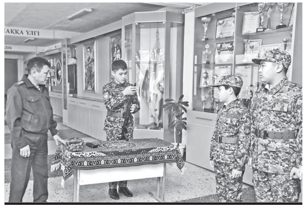
КАДЕТЫ, КРОМЕ СТРОЕВОЙ ПОДГОТОВКИ, ОСНОВ ВОИНСКОЙ СЛУЖБЫ, СТАЛИ ИЗУЧАТЬ И ОСНОВЫ ОГНЕВОЙ ПОДГОТОВКИ.