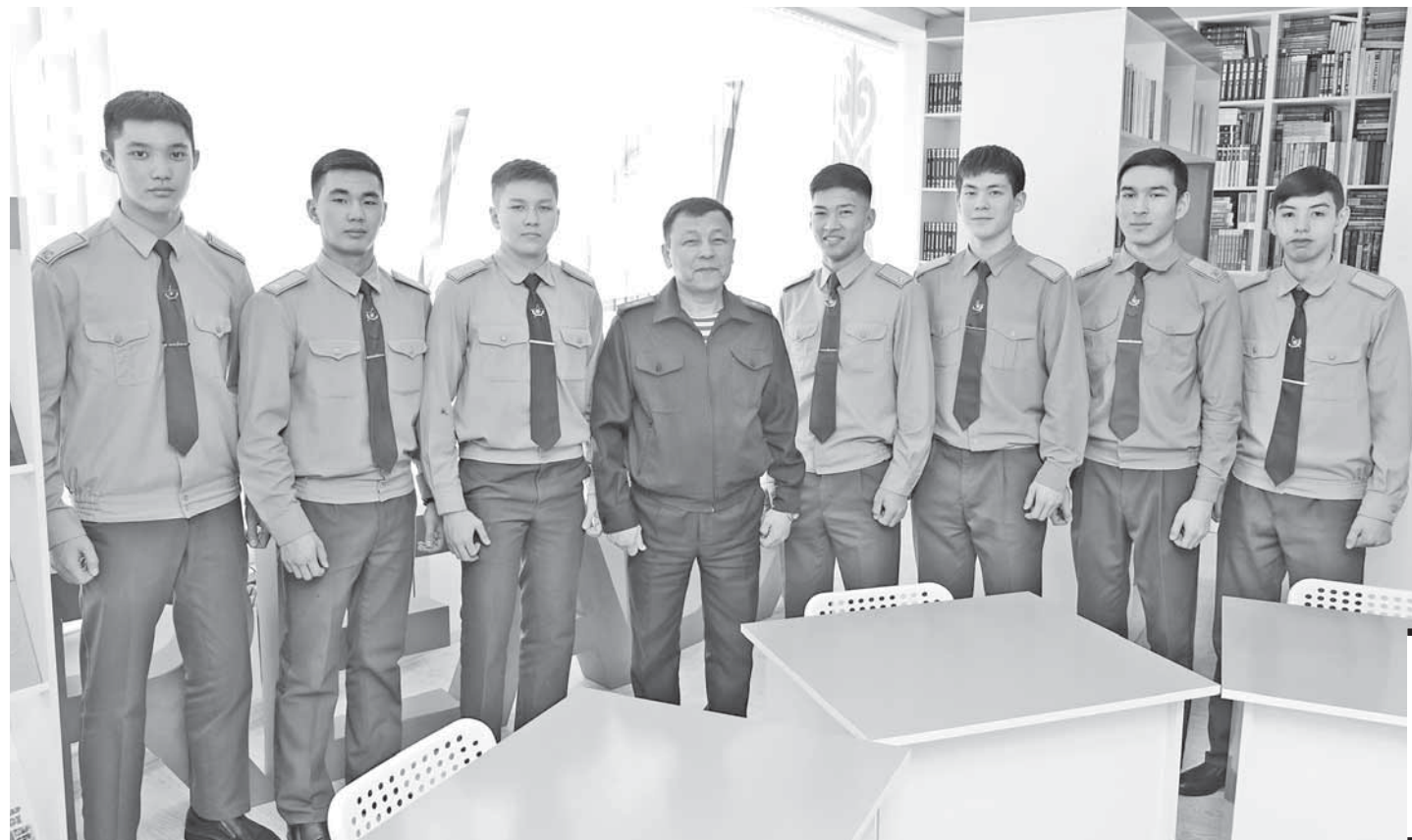
— ВЫПУСКНИКИ КАДЕТСКИХ КЛАССОВ СТОПРОЦЕНТНО ПОСТУПАЮТ КАК В ВОЕННЫЕ, ТАК И В ГРАЖДАНСКИЕ ВУЗЫ, ТО ЕСТЬ РЕБЯТА ИМЕЮТ ВЫСОКУЮ МОТИВАЦИЮ.

А сами учащиеся классов «Жас сарбаз» стали побеждать в городских и областных военно-спортивных играх «Отан қорғаушы» по военно-прикладным видам спорта «Қалқан», городском и областном смотре-конкурсах знаменных групп среди отрядов организаций образования Карагандинской области, а далее — и в международных соревнованиях. Сейчас в школе уже 18 классов «Жас сарбаз», в которых 346