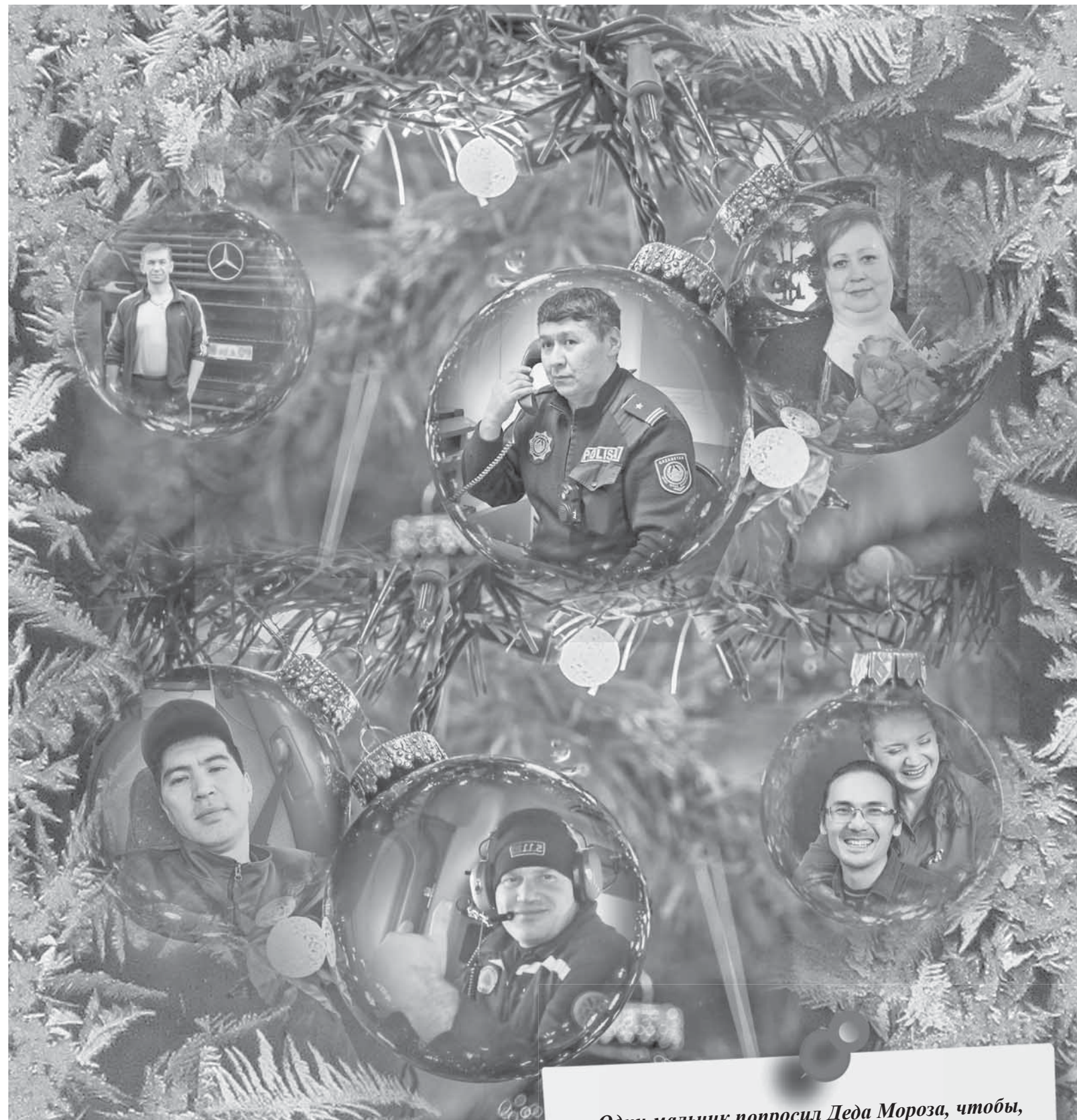
Коллаж: Юлия Быгушенко

– В основном нам приходилось вскрывать двери в домах и квартирах, так как в разгар празднования Нового года люди выбегали на улицу, чтобы запустить фейерверки, и забывали про ключи, – рассказывает спасатель. – К кому-то мы спускались с крыши на альпинистском снаряжении, так как не было другой возможности попасть внутрь помещения. В одно из таких новогодних дежурств мы с коллегами отработали несколько десятков подобных вызовов. Под конец так устали, что не чувствовали ног. И кто-то из гостей, пытаясь нас подбодрить, выстрелил в лицо хлопучкой,