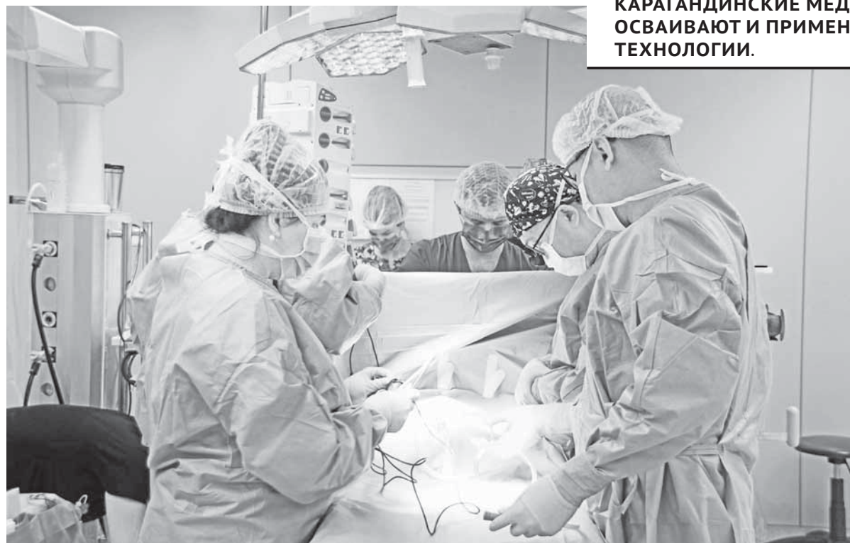
КАРАГАНДИНСКИЕ МЕДИКИ ПОСТОЯННО ОСВАИВАЮТ И ПРИМЕНЯЮТ НА ПРАКТИКЕ НОВЫЕ ТЕХНОЛОГИИ.

Казахстан – единственная страна, которая обеспечивает своих граждан бесплатными лекарствами на амбулаторном уровне, то есть не только при госпитализации в больницы. Такого нет даже в развитых странах Европы. На сегодняшний день Министерство здравоохранения включило в список 127 самых разных заболеваний, по которым пациентам бесплатно выдается более 400 наименований препаратов. Ежегодно для жителей Карагандинской области с хроническими заболеваниями из республиканского бюджета выделяется около 18 миллиардов тенге, чтобы обеспечить их бесплатными лекарствами. Еще более одного миллиарда тенге депутаты закладывают в местную казну для приобретения препаратов отдельным пациентам с редкими заболеваниями.