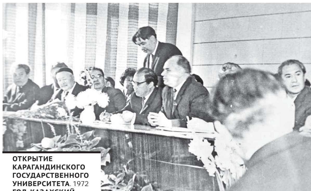
ОТКРЫТИЕ КАРАГАНДИНСКОГО ГОСУДАРСТВЕННОГО УНИВЕРСИТЕТА. 1972 ГОД. КАЗАХСКИЙ ПИСАТЕЛЬ-АКАДЕМИК С. МУКАНОВ, ПЕРВЫЙ РЕКТОР АКАДЕМИК Е.А. БУКЕТОВ.

С открытием университета в 1972 г. началась новая страница в истории вуза, в том числе и нашего факультета. Конечно, это были