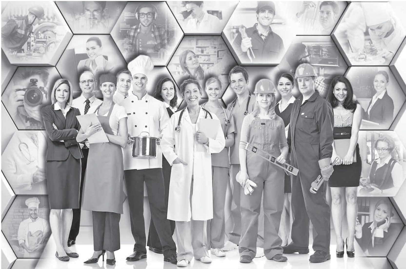
Коллаж Юрий Булушино