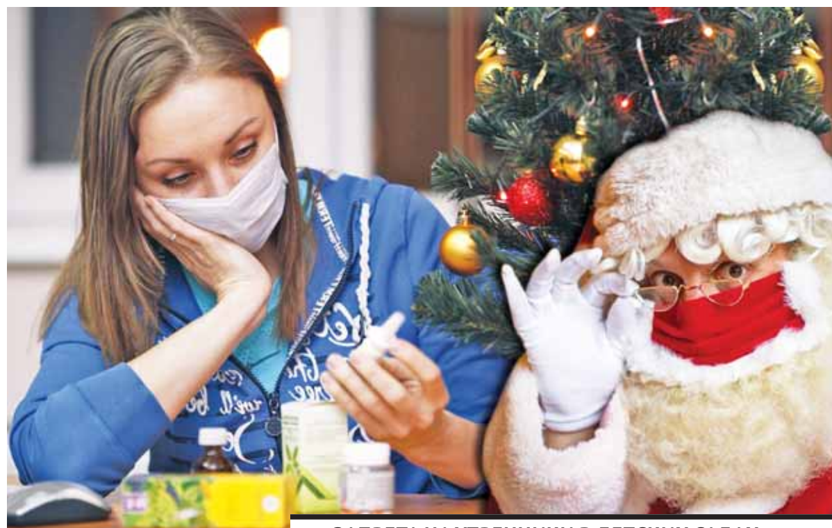
Коллаж Юрия Вилушенко

– На сегодняшний день зарегистрировано 45 случаев гриппа А3, который подтвержден в лабораторных условиях, – уточнил он во время брифинга на площадке Региональной службы коммуникаций. – Из них 15 детей в возрасте до 14 лет. Отмечу, что заболели те, кто не привит. С 1 октября зарегистрировано 38 311 случаев ОРВИ. Причем 62% из них – у детей и подростков. По сравнению с аналогичным пери-