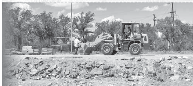
Коллаж Натальи Романовской

– разработан план детальной планировки рекреационной зоны «Бугылы» общей площадью 75 гектаров