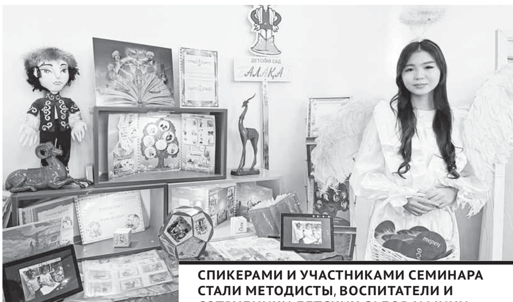
СПИКЕРАМИ И УЧАСТНИКАМИ СЕМИНАРА СТАЛИ МЕТОДИСТЫ, ВОСПИТАТЕЛИ И СОТРУДНИКИ ДЕТСКИХ САДОВ И МИНИ-ЦЕНТРОВ.

В Балхаше прошел городской семинар по дошкольному образованию. Работники этой сферы обсуждали актуальную тему «Воспитание ребенка через формирование у него уважения к родителям и семейным традициям».