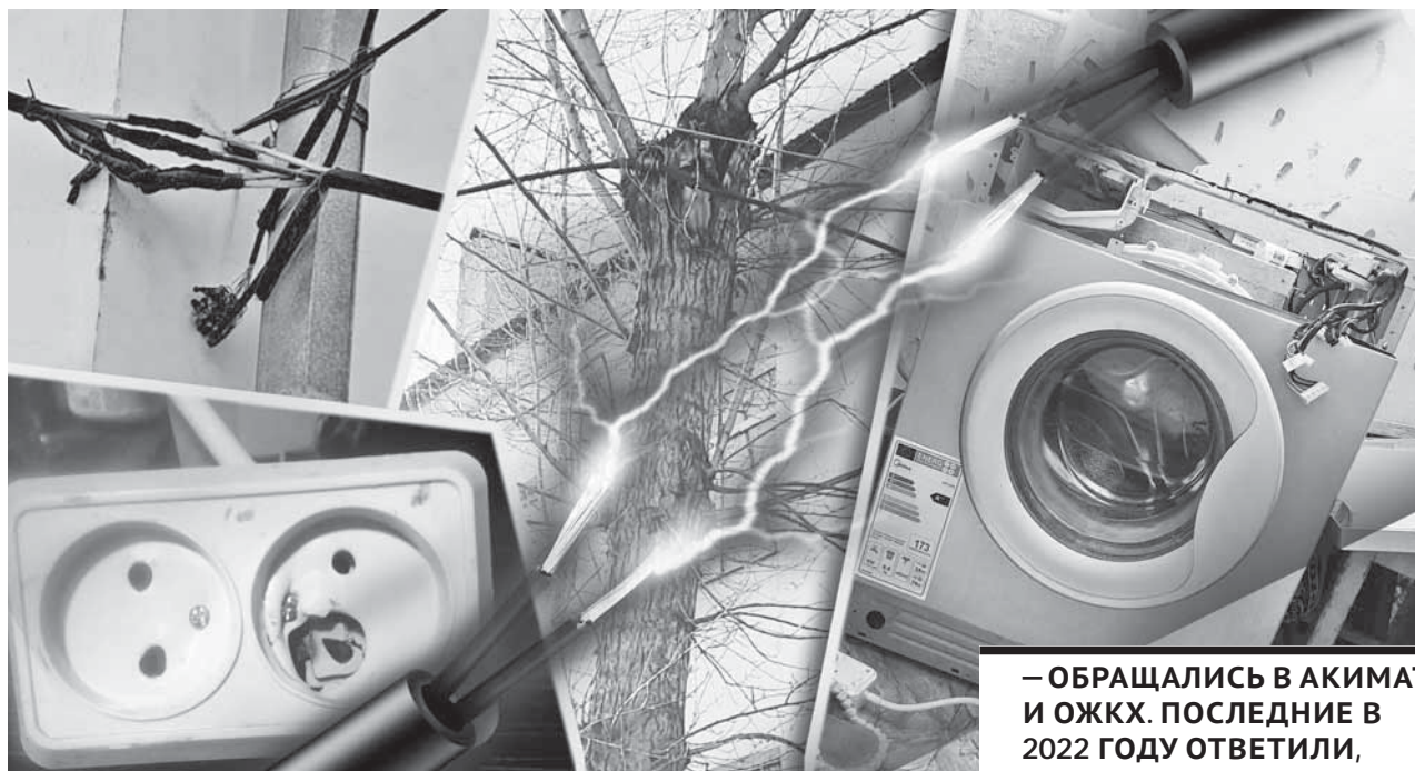
Коллаж Юрия Булученко

Жители трех многоквартирных домов в Темиртау уже несколько лет добиваются от властей решения вопроса с электросетями. В непогоду происходят частые замыкания, в результате чего массово выходит из строя бытовая техника.