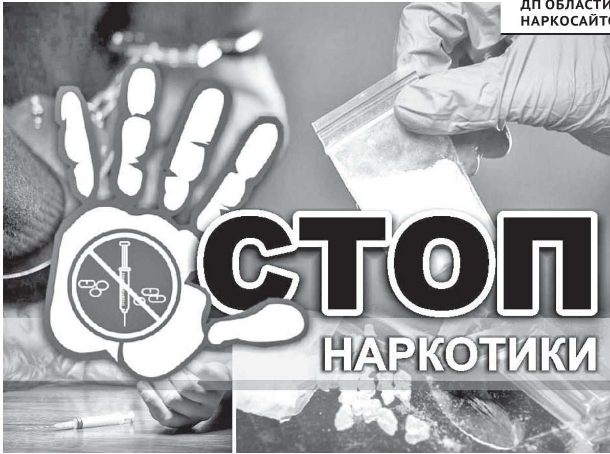
Коллаж Наталья Романовская

Реализовывать «пилот» в Карагандинской области поручили неправительственной организации – общественному объединению «Умнит». Их общественная инициатива называется «Здоровое поколение – здоровая нация». Основной подход – сотрудничество между разными секторами социума для достижения цели «Обще-