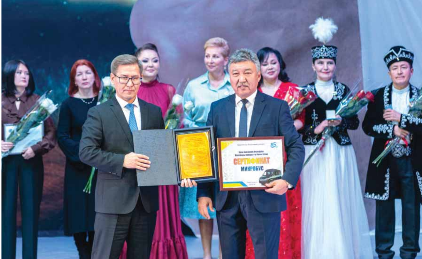
Десятилетия зрительской любви – 22 ноября состоялся гала-концерт, посвященный юбилею Карагандинского концертного объединения имени К. Байжанова. Мероприятие прошло в Академическом казахском драматическом театре имени С. Сейфуллина.

6 марта 1938 года постановлением Карагандинского облисполкома была образована филармония. В этом году исполнилось 85 лет культурному и творческому шаньраку, который с тех пор беззаветно служит народу и вместе со страной прошел большой и славный путь. В стенах карагандинской филармонии работали народные и заслуженные артисты, чьи имена известны в регионе и республике. Имя народного артиста КазССР Кали Байжанова было