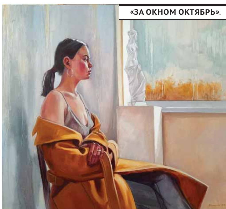
«ЗА ОКНОМ ОКТЯБРЬ».