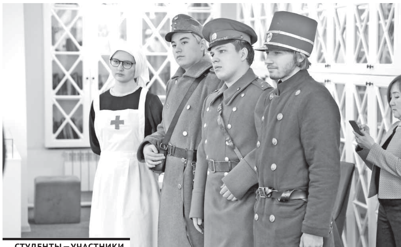
СТУДЕНТЫ – УЧАСТНИКИ КЛУБА – БЫЛИ ОДЕТЫ В РЕКОНСТРУИРОВАННУЮ УНИФОРМУ РОССИЙСКОЙ ИМПЕРИИ, АВСТРО-ВЕНГРИИ, ГЕРМАНИИ.

Интерактивную презентацию подготовил студенческий клуб военно-исторической реконструкции «Galea» при содействии кафедры всемирной истории и международных отношений Карагандинского университета им. Е.А. Букетова. Посетителям представили четыре экспозиции, посвященные различ-