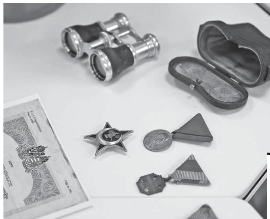
НА ОТДЕЛЬНОМ СТОЛИКЕ ПОСЕТИТЕЛИ МОГЛИ РАССМОТРЕТЬ РЕДКИЕ РАРИТЕТЫ – ИСТОРИЧЕСКИЕ АРТЕФАКТЫ ПЕРИОДА 1914-1918 ГОДОВ.

ПОЧЕМУ-ТО СЛОЖИЛОСЬ НЕПРАВИЛЬНОЕ МНЕНИЕ О ТОМ, ЧТО ПЕРВАЯ МИРОВАЯ ВОЙНА БЫЛА ДАЛЕКА ОТ КАЗАХСТАНА. НА САМОМ ДЕЛЕ НАША СТРАНА В НЕЙ АКТИВНО УЧАСТВОВАЛА.