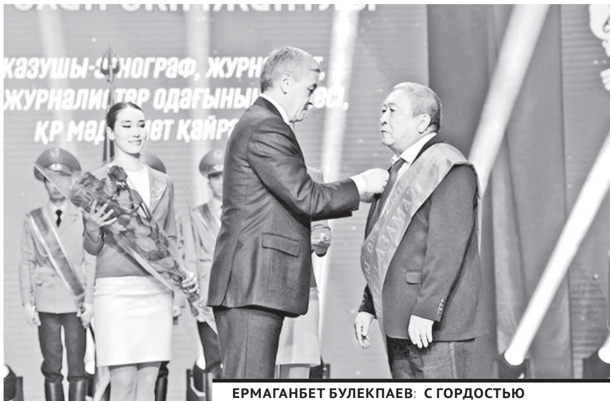
ЕРМАГАНБЕТ БУЛЕКПАЕВ: С ГОРДОСТЬЮ И БЕЗМЕРНЫМ УВАЖЕНИЕМ ХОЧУ ОТМЕТИТЬ ВКЛАД КАЖДОГО ЖИТЕЛЯ НАШЕГО РЕГИОНА В ДЕЛО ПРОЦВЕТЕНИЯ РЕСПУБЛИКИ.

В начале торжественного собрания глава региона отметил, что Карагандинская область вносит огромный вклад в развитие страны, являясь крупнейшим центром обрабатывающей промышленности, IT-индустрии, мощной кузницей кадров для различных отраслей.