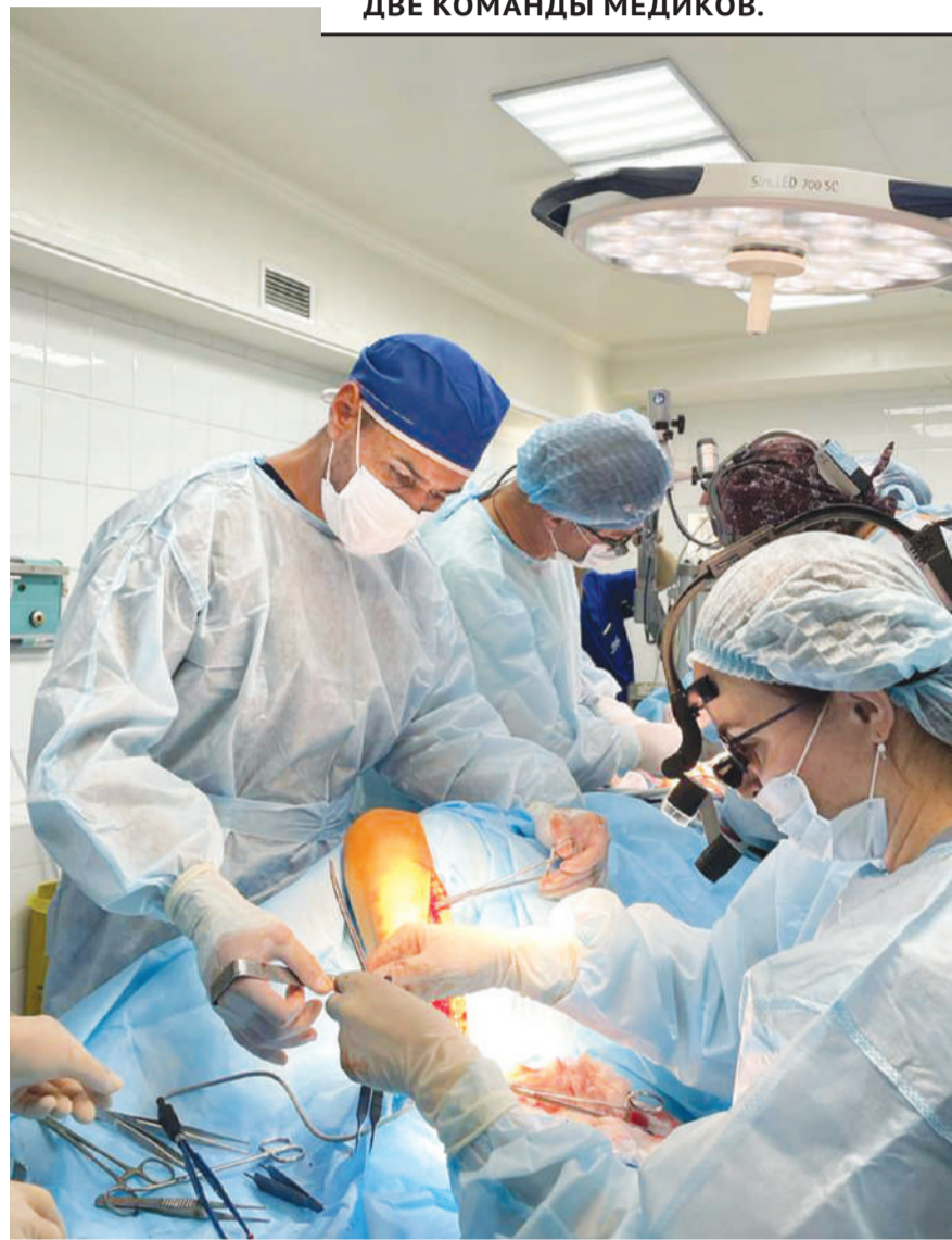
ОДНОВРЕМЕННО НАД ОПЕРАЦИОННЫМ СТОЛОМ ТРУДИЛИСЬ ДВЕ КОМАНДЫ МЕДИКОВ.

Подобные операции в Казахстане проводились всего четыре раза. Две из них сделали детям в Центре охраны материнства и детства в Астане, одну — в институте Сызганова в Алматы, карагандинская стала чет-