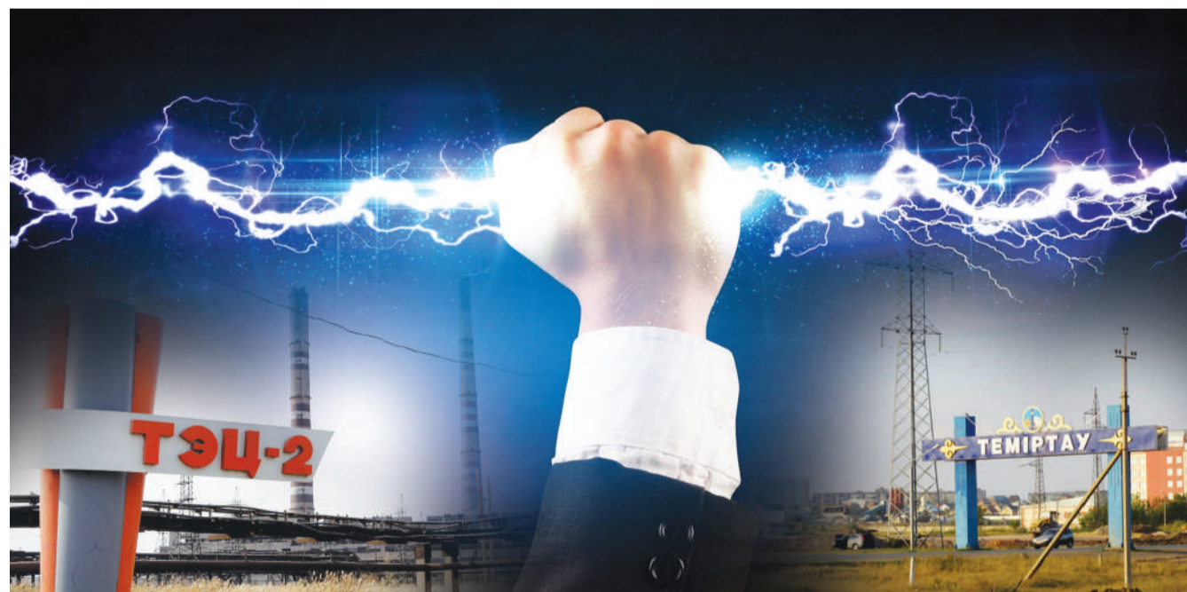
Коллаж Юрия Вилученко

Жителей Темиртау призывают снизить энергопотребление. Электрические сети сильно изношены и работают на пределе возможного. Особую тревогу у коммунальщиков вызывает предстоящая зима. Если ТЭЦ-2 вновь будет плохо подавать тепло, то город может остаться без электричества.