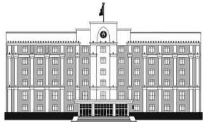
АКИМАТ КАРАГАНДИНСКОЙ ОБЛАСТИ