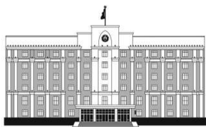
АКИМАТ КАРАГАНДИНСКОЙ ОБЛАСТИ

В этом году в городе на Балхаше отметили новоселье 45 семей-очередников. До конца года отдел строительства планирует купить еще 60 квартир для социально уязвимых слоев населения. Тем не менее жители жалуются на аварийное жилье.