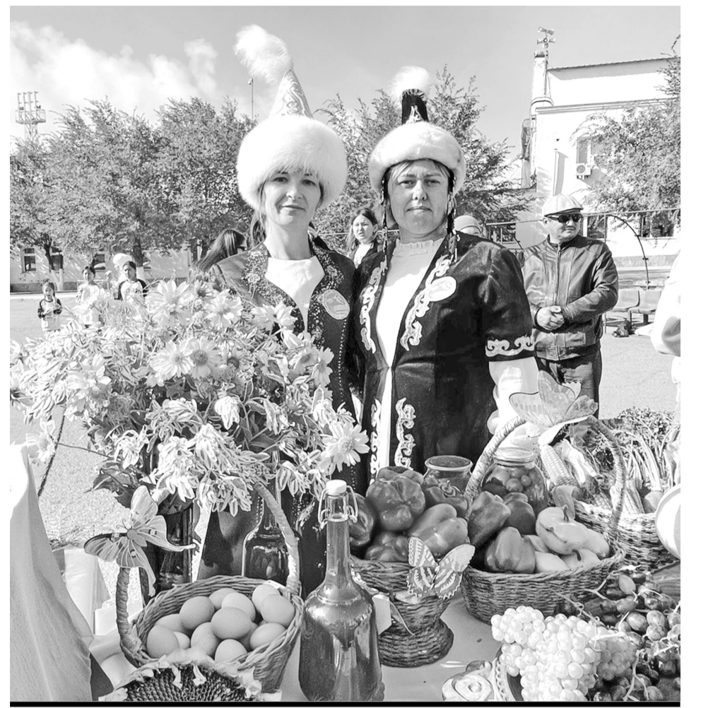
ДАРЫ КРАЯ МОЖНО БЫЛО УВИДЕТЬ НА ВЫСТАВКЕ «ЗОЛОТАЯ ОСЕНЬ НА БАЛХАШСКОЙ ЗЕМЛЕ».