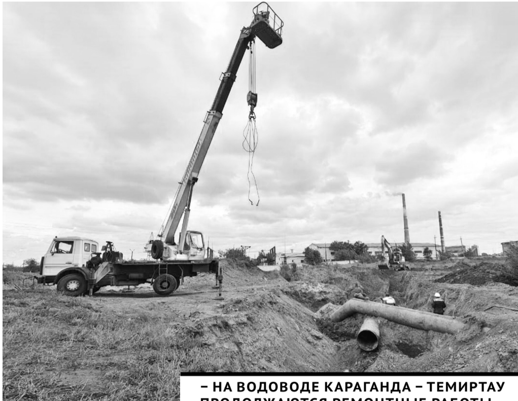
– НА ВОДОВОДЕ КАРАГАНДА – ТЕМИРТАУ ПРОДОЛЖАЮТСЯ РЕМОНТНЫЕ РАБОТЫ НА САМЫХ АВАРИЙНЫХ УЧАСТКАХ ТРУБОПРОВОДА.

Подрядчик, выигравший тендер на замену аварийных участков водовода Караганда – Темиртау, приступил к работе. Протяженность труб составляет 27 км, а износ сетей превышает 80%.