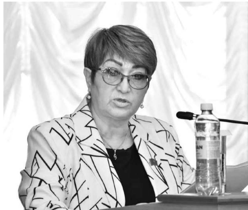
ДЕПУТАТ КАДИША ОСПАНОВА ГОВОРИЛА О СОВЕРШЕНСТВОВАНИИ ДУАЛЬНОГО ОБРАЗОВАНИЯ, РАЗВИТИИ МОЛОДЕЖНОГО ПРЕДПРИНИМАТЕЛЬСТВА, ЭКОНОМИКИ НОВЫХ СЕКТОРОВ.