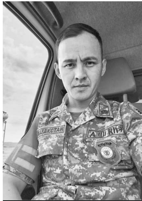
О ГЕРОИЧЕСКОМ ПОСТУПКЕ ВОЕННОСЛУЖАЩИХ СТАЛО ИЗВЕСТНО ИЗ ПУБЛИКАЦИЙ В СОЦИАЛЬНОЙ СЕТИ.