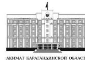
АКИМ КАРАГАНДИНСКОЙ ОБЛАСТИ

В акимате Карагандинской области аппаратное совещание началось с минуты молчания. Госслужащие почтили память погибших при пожаре на шахте «Казахстанская» угольного департамента АО «АрселорМиттал Темиртау».