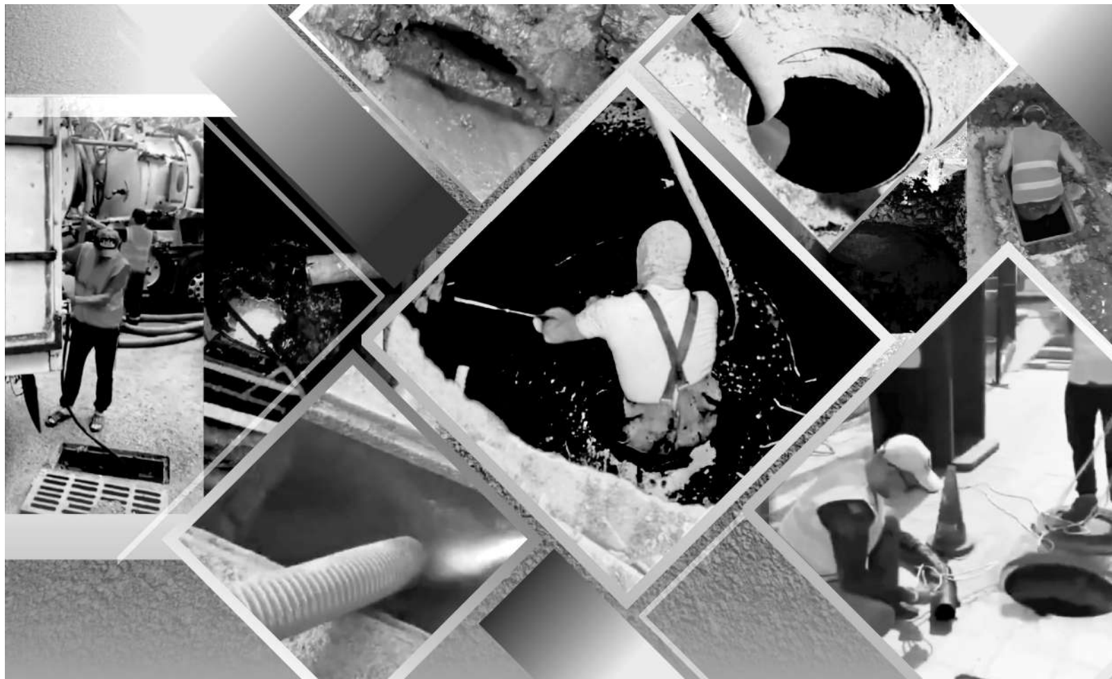
Коллаж Натальи Романовской

В этом году работа продолжилась. Как ранее отметил аким города, чтобы Караганда была готова к приему большого количества талых и дождевых вод,