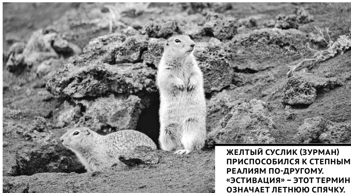
ЖЕЛТЫЙ СУСЛИК (ЗУРМАН) ПРИСПОСОБИЛСЯ К СТЕПНЫМ РЕАЛИЯМ ПО-ДРУГОМУ. «ЭСТИВАЦИЯ» – ЭТОТ ТЕРМИН ОЗНАЧАЕТ ЛЕТНЮЮ СПЯЧКУ.