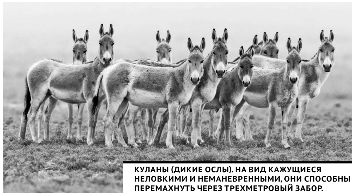
КУЛАНЫ (ДИКИЕ ОСЛЫ). НА ВИД КАЖУЩИЕСЯ НЕЛОВКИМИ И НЕМАНЕВРЕННЫМИ, ОНИ СПОСОБНЫ ПЕРЕМАХНУТЬ ЧЕРЕЗ ТРЕХМЕТРОВЫЙ ЗАБОР.