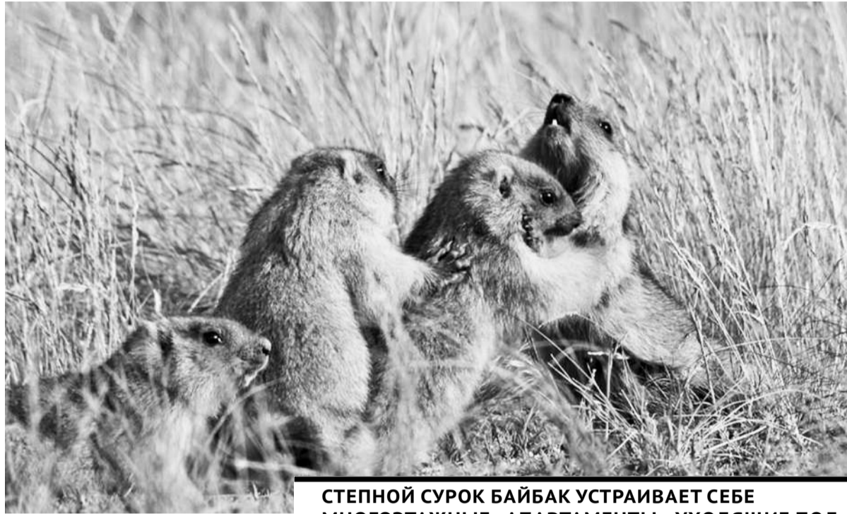
СТЕПНОЙ СУРОК БАЙБАК УСТРАИВАЕТ СЕБЕ МНОГОЭТАЖНЫЕ «АПАРТАМЕНТЫ», УХОДЯЩИЕ ПОД ЗЕМЛЮ ДО 4 МЕТРОВ В ГЛУБИНУ!

Что мы знаем о том, как существуют многочисленные обитатели степи в суровых условиях резко континентального климата? Вторая встреча из серии лекций «Steppe Science Talks», которыми делится биолог и эколог Ирина Григорьева в ЭкоМузее, была посвящена тому, как приспосабливаются животные к условиям от +40°C до -40°C.