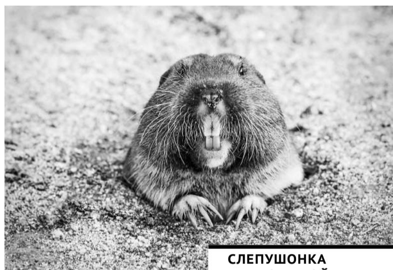
СЛЕПУШОНКА – НЕБОЛЬШОЙ ЗВЕРЕК СЕМЕЙСТВА ХОМЯКОВЫХ – ПОШЛА ЕЩЕ ДАЛЬШЕ.

в таких условиях, где не могут выжить другие.