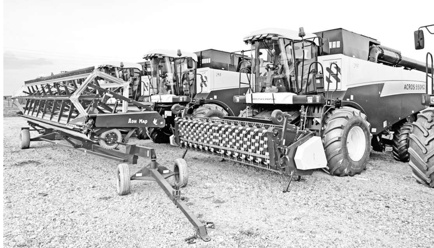
Осакаровский район

ТЕХНИКА БЫЛА ВЗЯТА В ЛИЗИНГ, СУБСИДИРУЕТСЯ ПРИОБРЕТЕНИЕ СЕМЯН, МИНЕРАЛЬНЫХ УДОБРЕНИЙ, ГЕРБИЦИДОВ, ФУНГИЦИДОВ.