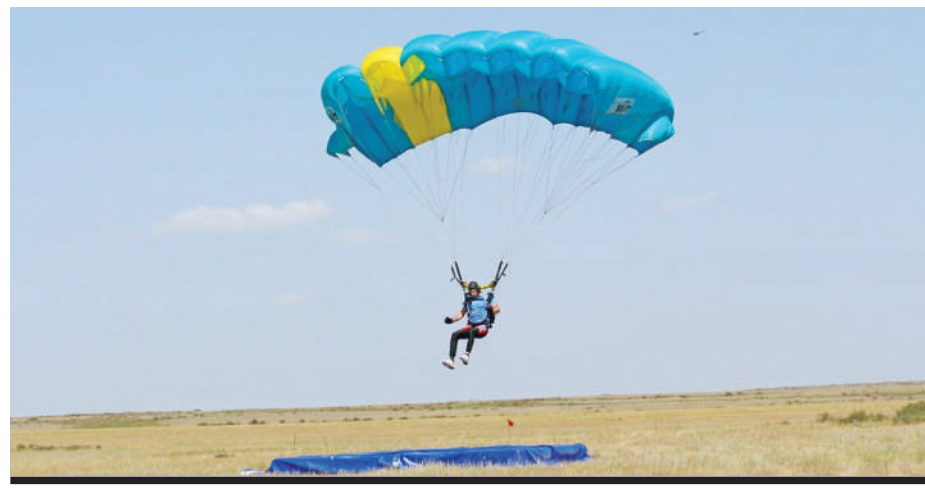
САМОМУ МОЛОДОМУ УЧАСТНИКУ СОРЕВНОВАНИЙ ИСПОЛНИЛОСЬ 16 ЛЕТ. НА ЕГО СЧЕТУ – БОЛЕЕ 180 ПРЫЖКОВ. А САМОМУ СТАРШЕМУ ПАРАШЮТИСТУ – 67.

– В этот спорт меня привел мой отец, бывший десантник. Никогда не забуду свой первый прыжок... Волнуешься от того, что не знаешь, как все будет. У новичков, кстати, принудительное открытие парашюта через 3 секунды. Как сделал шаг с борта, испытал эйфорию. А вот дальнейшие прыжки – уже было страшно: ведь знаешь, что произойдет дальше. В наших кругах говорят: если перестал бояться, то не нужно идти