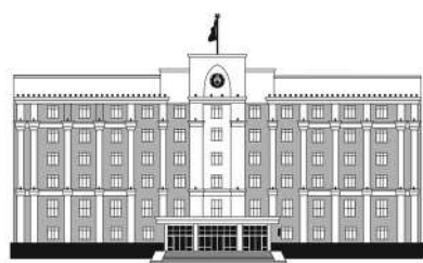
АКИМАТ КАРАГАНДИНСКОЙ ОБЛАСТИ