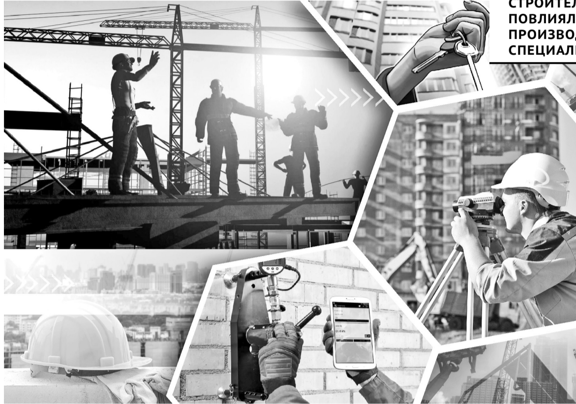
Коллаж Натальи Романовской

– В общей сложности мы держим на контроле около 60 возводимых объектов жилья. По закону каждый застройщик должен известить нас о начале работ. Это делается в онлайн-режиме, через веб-портал «электронного правительства». К уведомлению прилагаются проектно-сметная документация с экспертизой, договоры с техническим и авторским надзором и другие сопроводительные документы. Бывает, что у компании чего-то из этого не хватает, и она, не извещая нас, на свой страх и риск приступает к строительству. По этой причине застройщиков привлекли к административной ответственности по статьям 314, 316, 321 и 463 КоАП РК. Решением суда на объектах строительно-монтажные работы приостановлены до получения необходимых разрешительных документов,