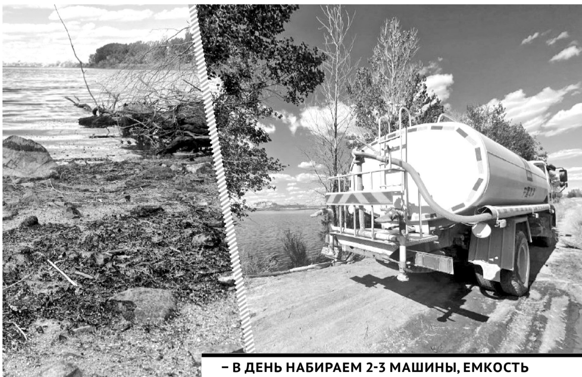
– В ДЕНЬ НАБИРАЕМ 2-3 МАШИНЫ, ЕМКОСТЬ ЦИСТЕРНЫ – 12 ТОНН. ВОДА ИСПОЛЬЗУЕТСЯ НА РАБОТАХ ПРИ УКЛАДКЕ АСФАЛЬТА.

Озеро в заказнике Бектау-ата используют как источник для строительства дороги. Рабочие откачивают воду для производственных нужд. Из-за этого, как утверждают местные жители, уровень ее падает.