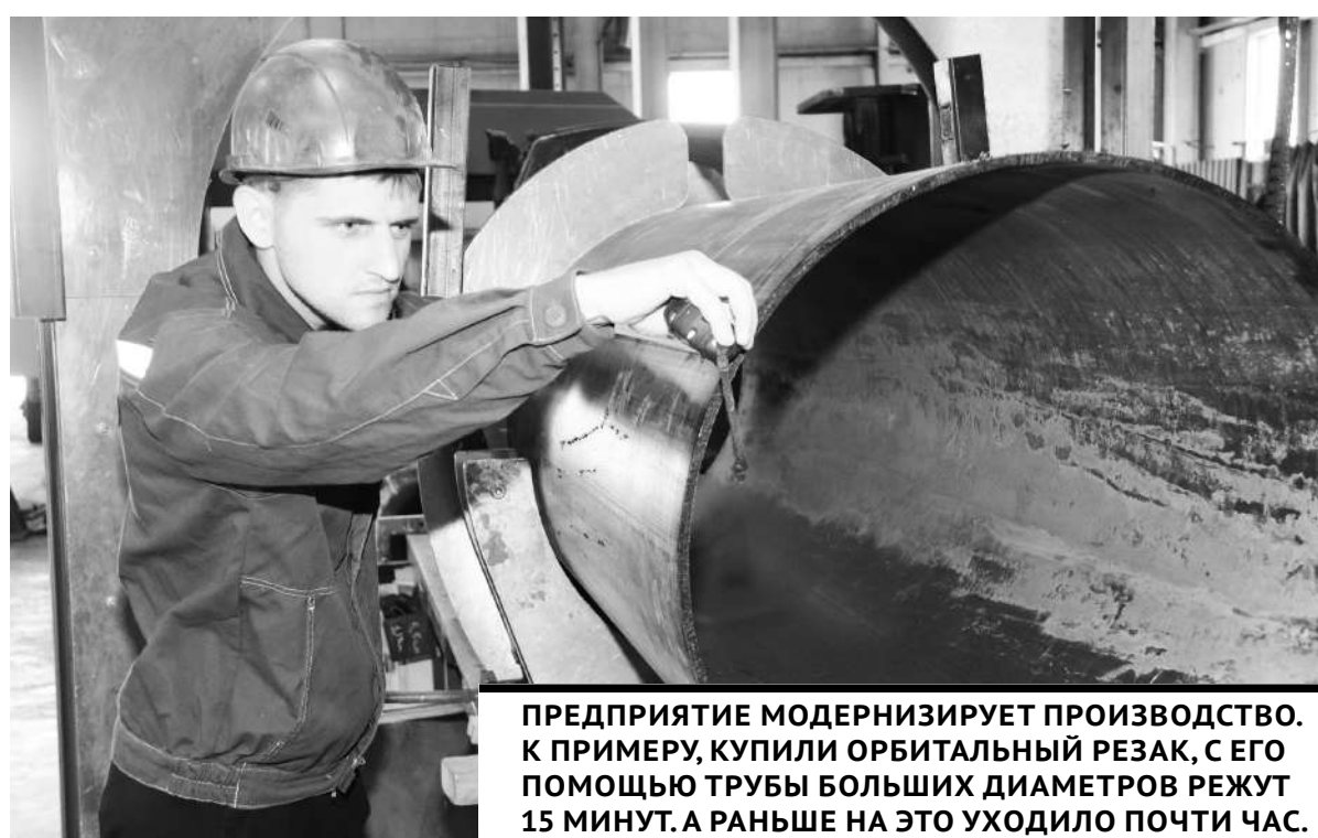
ПРЕДПРИЯТИЕ МОДЕРНИЗИРУЕТ ПРОИЗВОДСТВО. К ПРИМЕРУ, КУПИЛИ ОРБИТАЛЬНЫЙ РЕЗАК, С ЕГО ПОМОЩЬЮ ТРУБЫ БОЛЬШИХ ДИАМЕТРОВ РЕЖУТ 15 МИНУТ. А РАНЬШЕ НА ЭТО УХОДИЛО ПОЧТИ ЧАС.