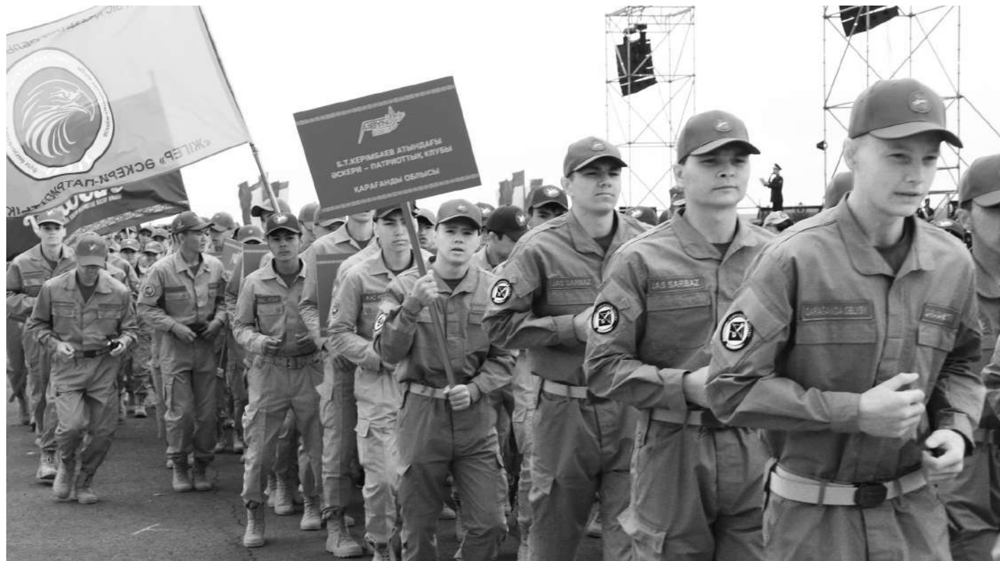
УЧАСТНИКИ СБОРА, ВОСПИТАННИКИ ВОЕННО-ПАТРИОТИЧЕСКИХ КЛУБОВ, ЧЛЕНЫ ДВИЖЕНИЯ «ЖАС САРБАЗ», НА ПРОТЯЖЕНИИ БЛИЖАЙШИХ ДНЕЙ ПОКАЖУТ СВОЮ СИЛУ, ЛОВКОСТЬ И УМ, А ТАКЖЕ ВОЛЮ К ПОБЕДЕ.

спубликанского военно-патриотического сбора заместитель министра обороны РК, генерал-лейтенант Султан Камалетдинов отметил, что участие в «Айбын-2023» поддержали коллеги из Узбекистана и Азербайджана.