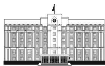
АКИМАТ КАРАГАНДИНСКОЙ ОБЛАСТИ