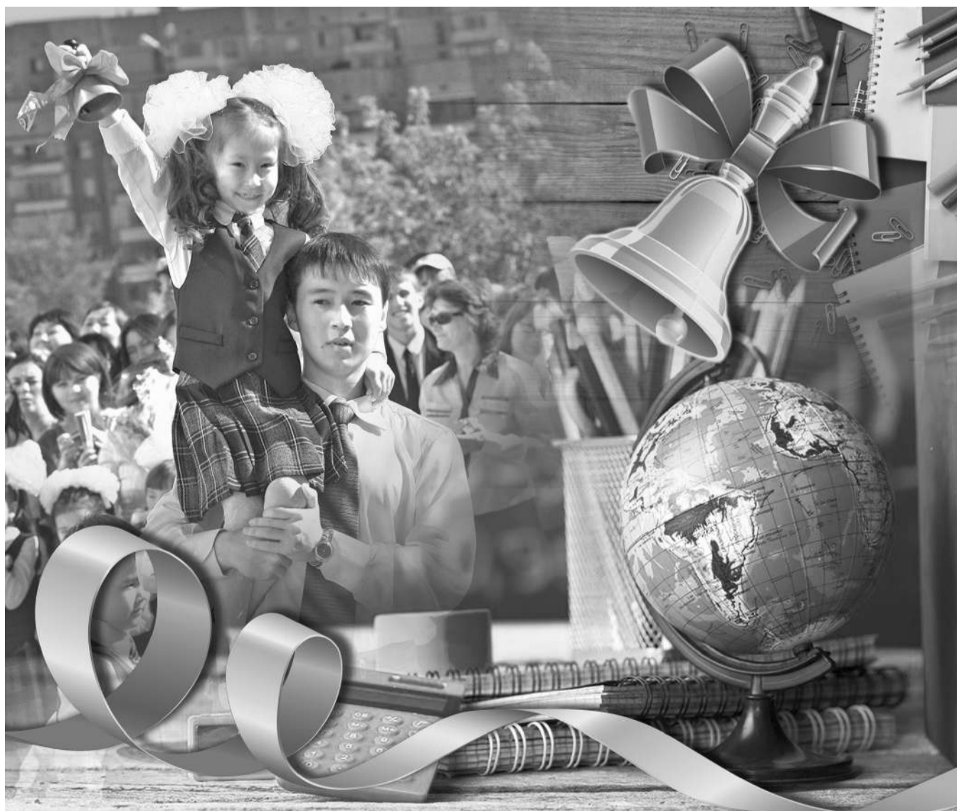
Коллаж Юрия Вилушенко

«Материалы к выпускным экзаменам будут доставлены во все отделы