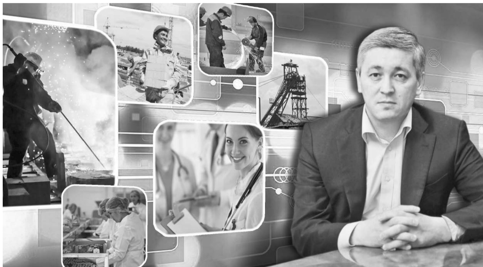
Коллаж Юрия Вилушенко

Свое выступление аким области начал с того, что перечислил основные показатели экономики региона только за одни сутки. Так, по его словам, за это время на предприятиях «АрселорМиттал Тимиртау» добывается 17 тысяч тонн угля, выплавляется более 8,5 тысячи тонн стали, а объем производства стального проката до-