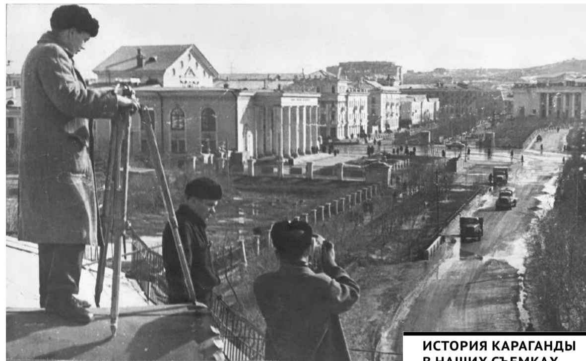
ИСТОРИЯ КАРАГАНДЫ В НАШИХ СЪЕМКАХ. ТЕМИРТАУ.

– Один никогда решения не принимаю, всегда советуюсь с коллективом, в день у меня не-