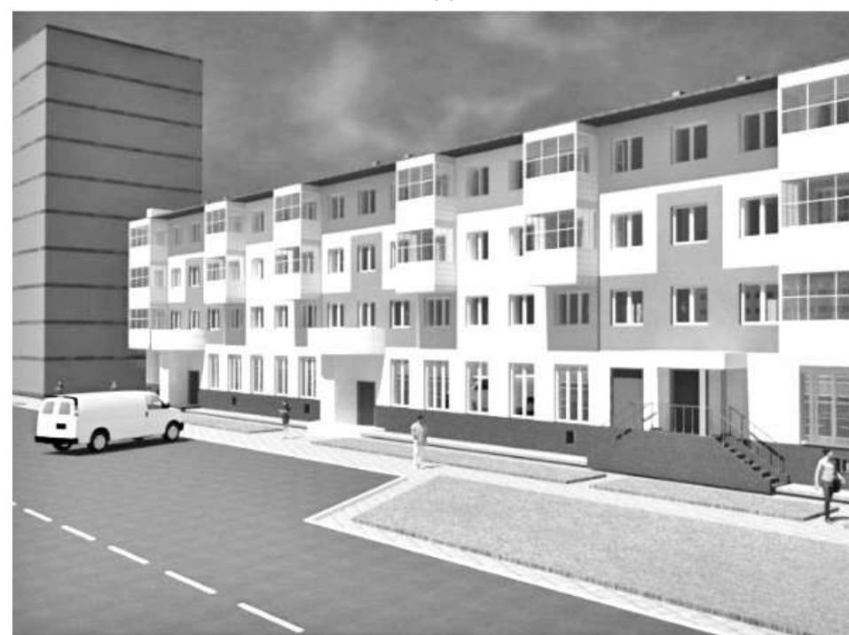
ПЕРСПЕКТИВНЫЙ ВИД ПОСЛЕ РЕМОНТА

ивать реконструируемые улицы. Будут приводиться в соответствие не только тротуары, парковочные места, но и входные группы зданий, вывески, билборды, уличная мебель и многое другое. Основная цель дизайн-кода – упорядочить городскую среду.