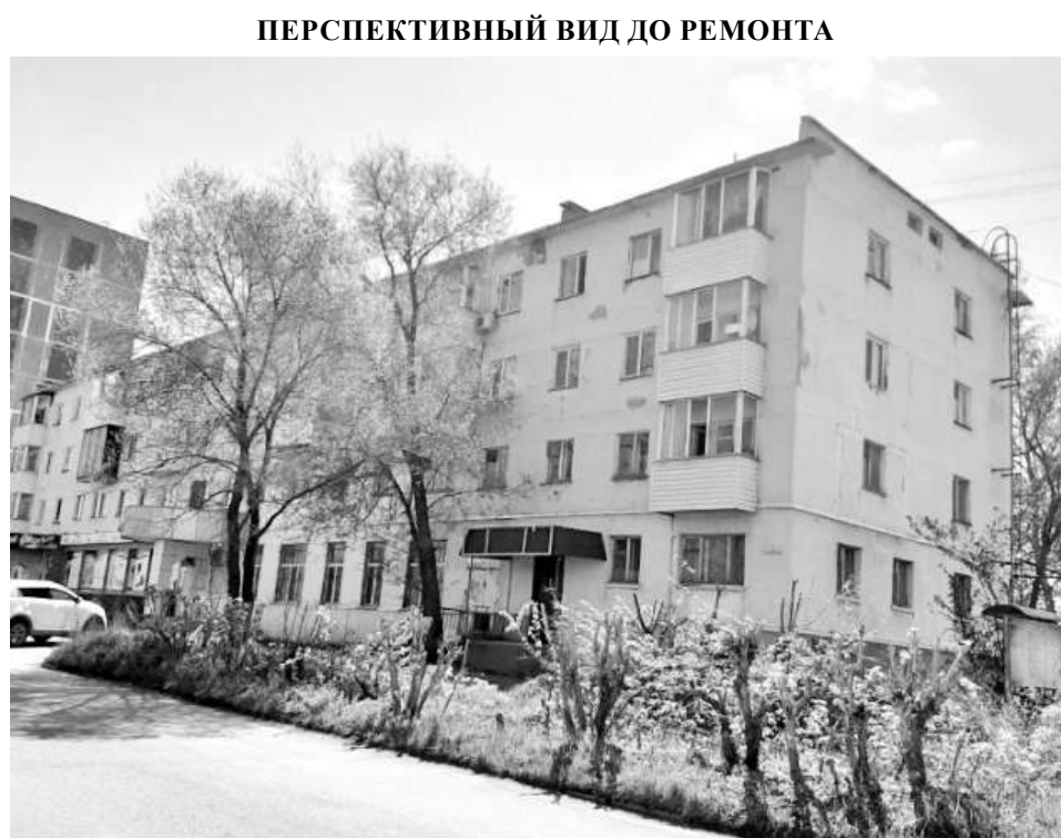
ПЕРСПЕКТИВНЫЙ ВИД ДО РЕМОНТА