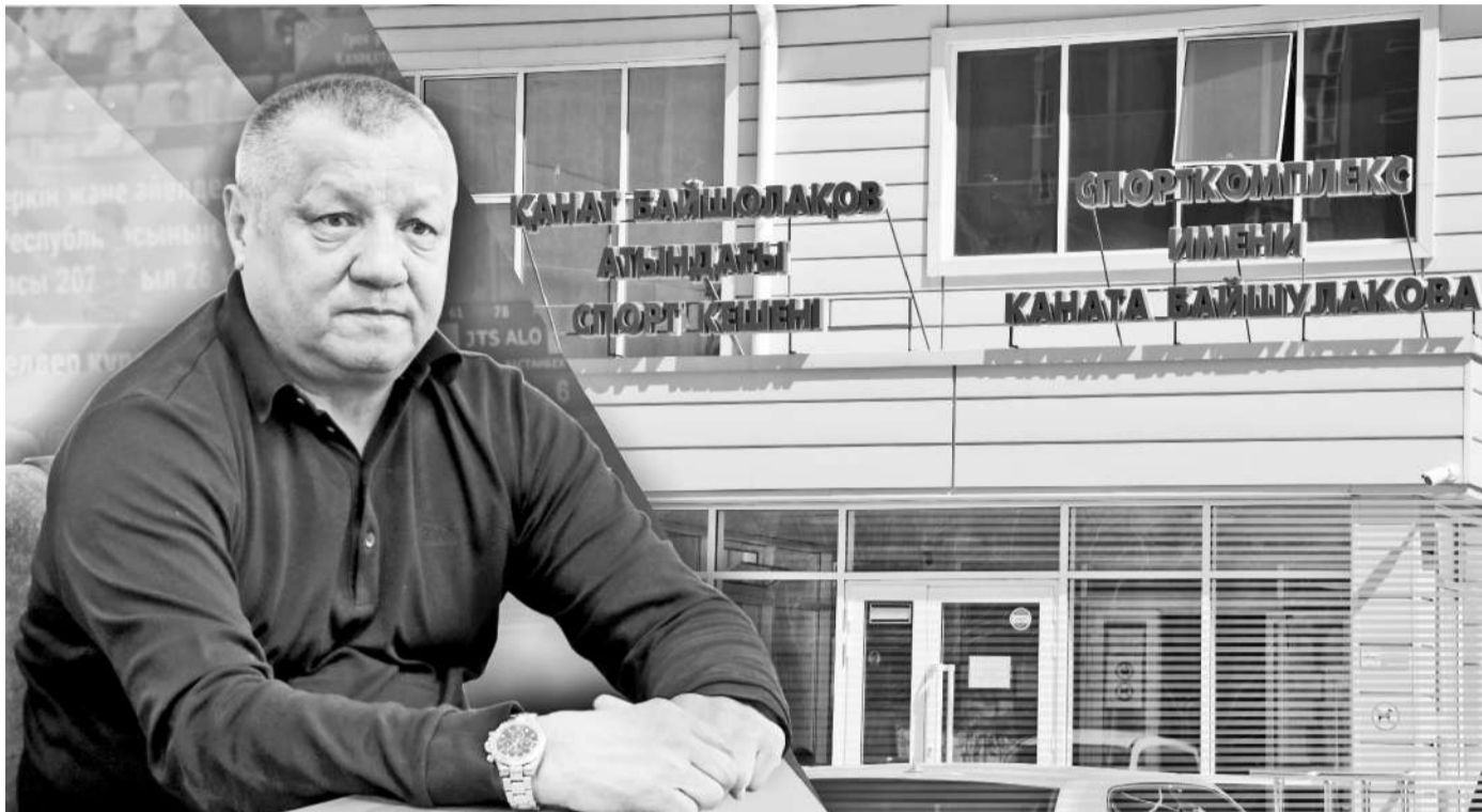
Коллаж Натальи Романовской

Совсем недавно по инициативе группы отечественных меценатов и известных тренеров в Казахстане был создан спортивный клуб «Jenys», который специализируется на профессиональной подготовке дзюдоистов. В апреле и мае нынешнего года он представлял нашу страну в международном проекте – Континентальной лиге дзюдо, проходившей в столице Российской Федерации.