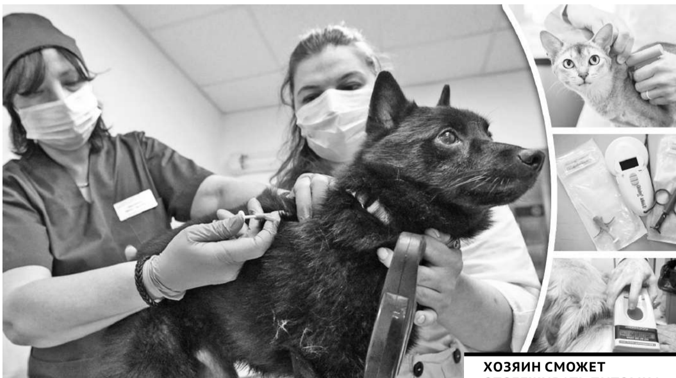
Коллаж Юрия Булушено

С 1 сентября 2023 года, согласно Закону РК «Об ответственном обращении с животными», в республике станет обязательным чипирование домашних животных. Это электронная идентификация собак, кошек, которая представляет собой имплантацию животному микросхемы с уникальным индивидуальным 15-значным номером. Что это за процедура и как она проводится, мы поинтересовались у специалистов.