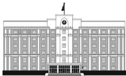
АКИМАТ КАРАГАНДИНСКОЙ ОБЛАСТИ