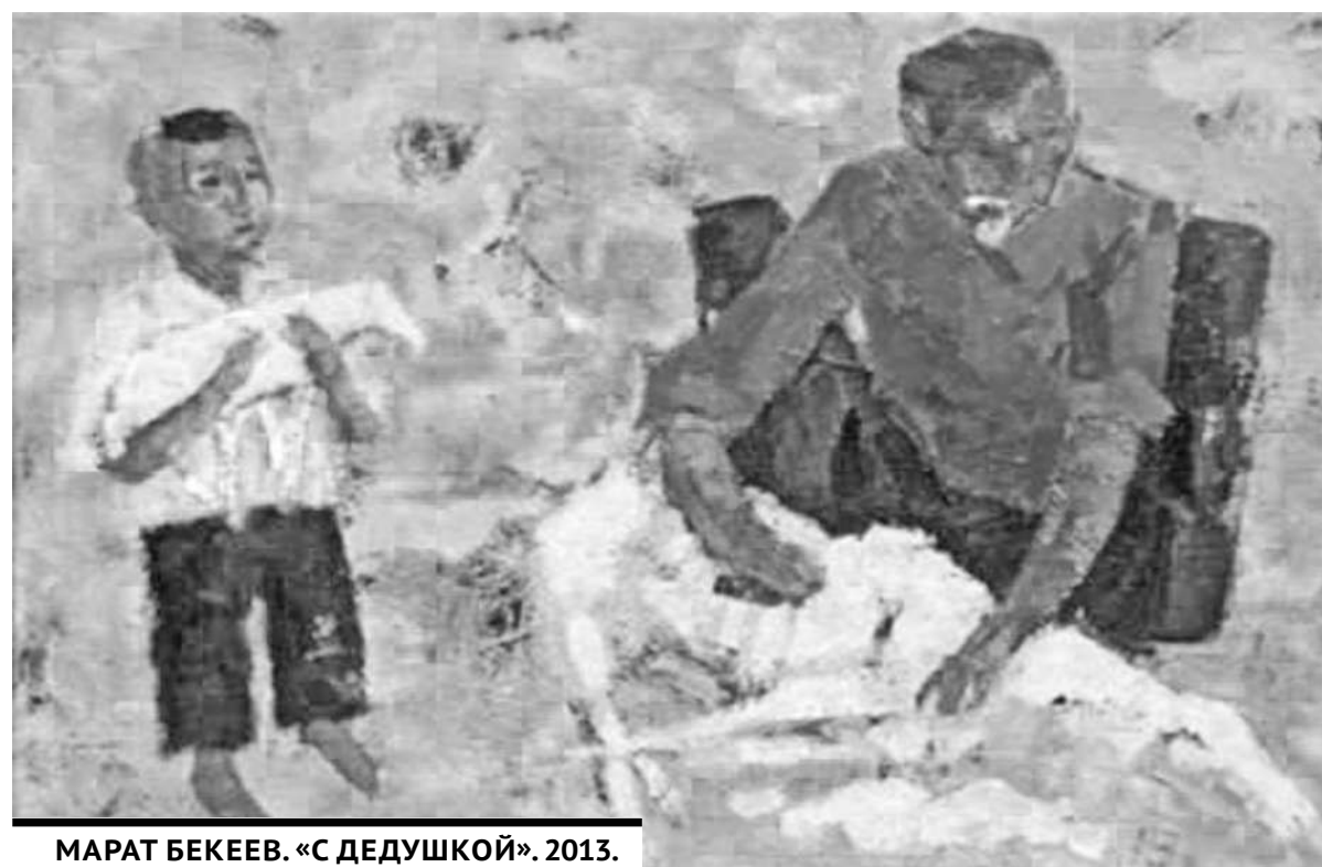
МАРАТ БЕКЕЕВ. «С ДЕДУШКОЙ». 2013.