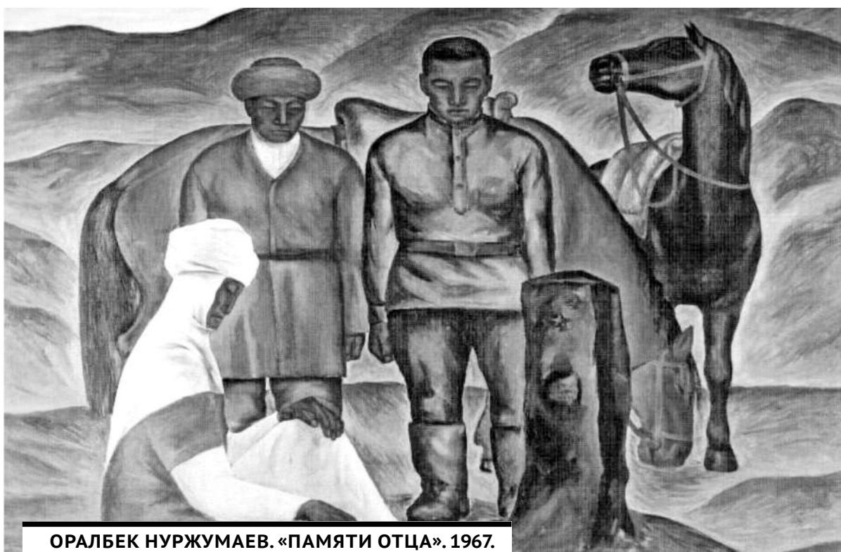
ОРАЛБЕК НУРЖУМАЕВ. «ПАМЯТИ ОТЦА». 1967.