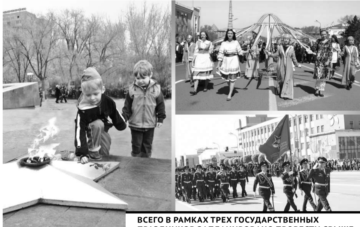
Коллаж Юрия Выгушено

Как рассказала на аппаратном совещании и.о. руководителя управления внутренней политики Гулнараим Кантарбекова, всего в рамках трех государственных праздников запланировано провести свыше 250 различных мероприятий. В частности, на центральных площадях и в парках будут организованы социальные и благотворительные ярмарки, экологические акции, выставки, фестивали, спортивные состязания, челленджи и так далее. Некоторые из них уже проходят