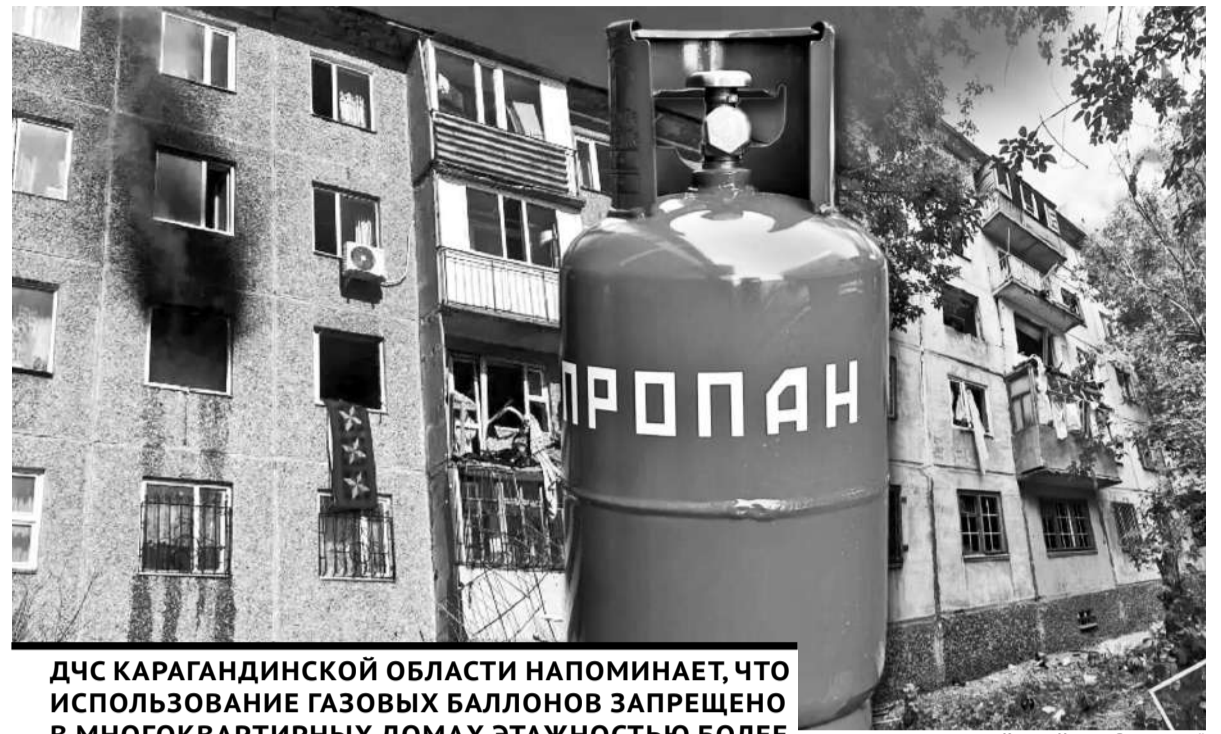
ДЧС КАРАГАНДИНСКОЙ ОБЛАСТИ НАПОМИНАЕТ, ЧТО ИСПОЛЬЗОВАНИЕ ГАЗОВЫХ БАЛЛОНОВ ЗАПРЕЩЕНО В МНОГОКВАРТИРНЫХ ДОМАХ ЭТАЖНОСТЬЮ БОЛЕЕ ДВУХ ЭТАЖЕЙ.

ДЧС Карагандинской области напоминает, что использование газовых баллонов запрещено в многоквартирных домах этажностью более двух этажей. Необходимо использовать только исправное газовое оборудование. В случае его некорректной работы необходимо обращаться к специалистам. Опасно проводить ремонтные работы самостоятельно. Приобретать газовые баллоны и газовое