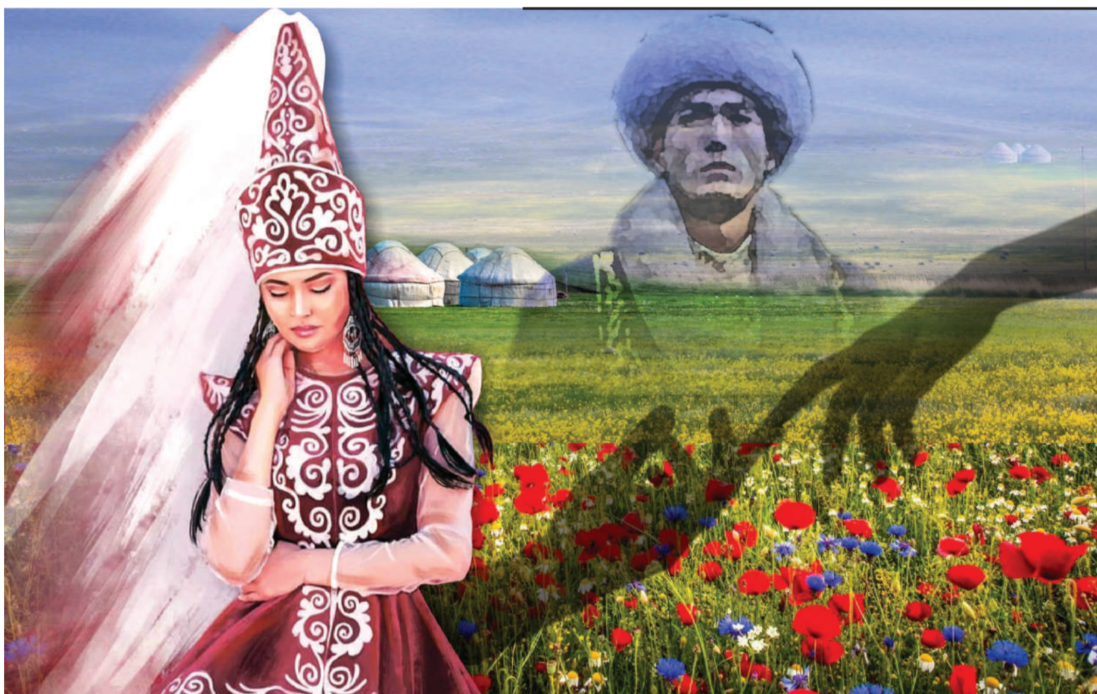
Коллаж Натальи Романовской

Так, сватав своих детей, родители постоянно говорят им об этом. И когда ребенок вырастает, он и морально, и психологически готов к тому, что у него уже есть жених или невеста. Они о других даже не думают, ни на кого не смотрят. Сосватанные дети пони-