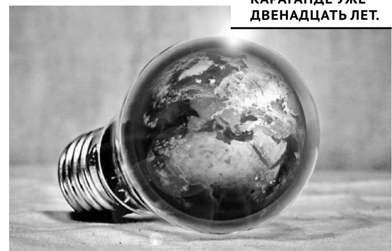
«ЧАС ЗЕМЛИ» В ПОДОБНОМ ФОРМАТЕ ПРОХОДИТ В КАРАГАНДЕ УЖЕ ДВЕНАДЦАТЬ ЛЕТ.

Затем началось самое интересное. Гости ЭкоМузея рисова-