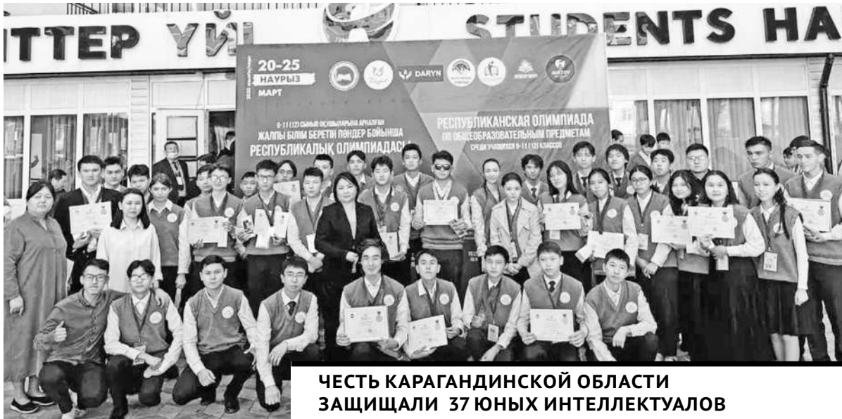
ЧЕСТЬ КАРАГАНДИНСКОЙ ОБЛАСТИ ЗАЩИЩАЛИ 37 ЮНЫХ ИНТЕЛЛЕКТУАЛОВ ИЗ СПЕЦИАЛИЗИРОВАННЫХ ШКОЛ ДЛЯ ОДАРЕННЫХ ДЕТЕЙ.

В Шымкенте прошла традиционная республиканская олимпиада по общеобразовательным предметам естественно-математического направления для учащихся 9-11 (12) классов. Цель интеллектуального состязания – пропаганда научных знаний и развитие у учащихся интереса к научной деятельности, а также создание необходимых условий для выявления одаренных детей. Олимпиада проходила в два тура: первый – теоретический, второй – практический. Старшеклассники демонстрировали свои знания по математике, физике, биологии, информатике, химии и географии.