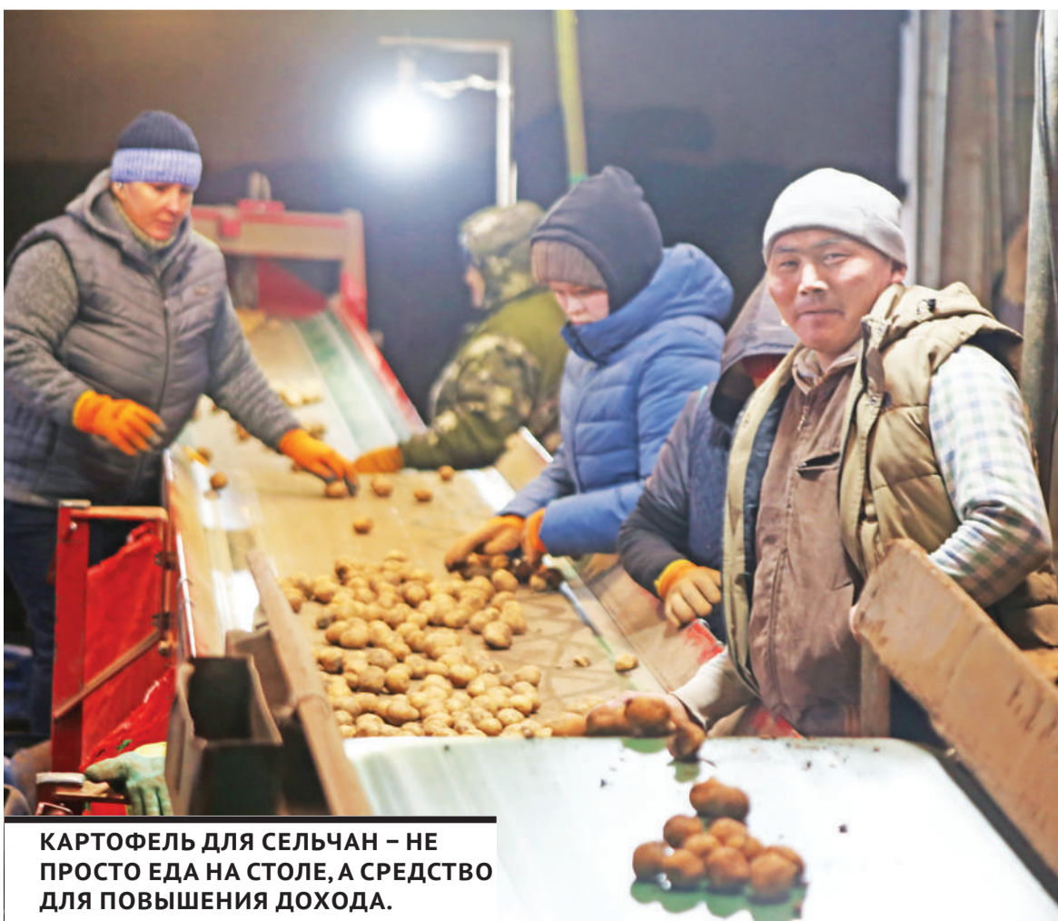
КАРТОФЕЛЬ ДЛЯ СЕЛЬЧАН – НЕ ПРОСТО ЕДА НА СТОЛЕ, А СРЕДСТВО ДЛЯ ПОВЫШЕНИЯ ДОХОДА.

Картофель для сельчан – не просто еда на столе, а средство для повышения дохода. Ведь практически все коксуны задействованы в его посадке, уходе и сборе. И получают за этот труд они достойную оплату – почти как горняки или металлурги. Впрочем, все по порядку.