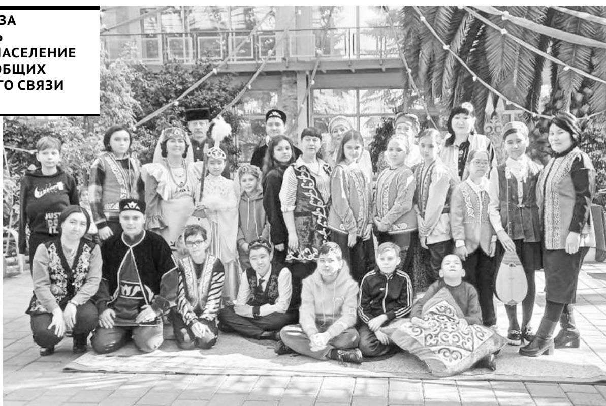
г. Темиртау

сад стал местом, где гости могли погрузиться в культуру и традиции Казахстана. Представители разных этнокультурных центров рассказали о своих значимых праздниках, а также показали творческие номера, связанные с их культурой и обычаями. Соревновались участники мероприятия и в традиционных играх, таких как перетягивание каната, асыки и другие. Завершилась встреча общим чаепитием, где гости могли отведать национальные блюда и напитки.