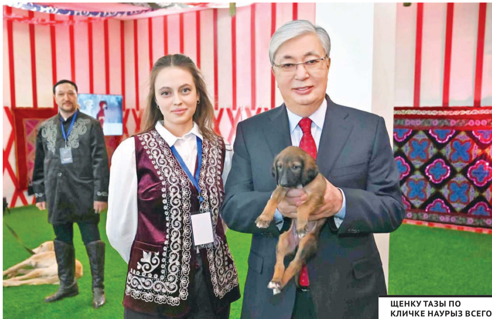
ЩЕНКУ ТАЗЫ ПО КЛИЧКЕ НАУРЫЗ ВСЕГО ПОЛТОРА МЕСЯЦА.